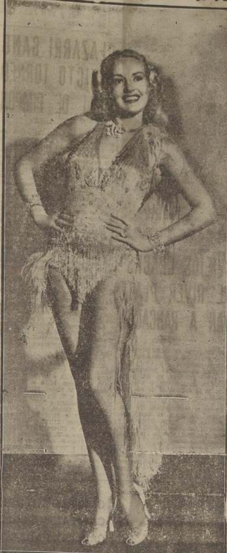
Son famosas las piernas de BETTY GRABLE; sólo comparables a las de Marlene Dietrich. Al contrario de la mayoría de las estrellas, no sigue un régimen dietético especial. Tampoco practica los deportes.

CAMINA DESCALZA—No sé a qué atribuirlo. Actualmente a dos cosas, pero estoy segura que lo sea. Una es que me agrada andar descalza. Habrá visto que el primero que hice al llegar al estudio fue sacarme los zapatos. Cuando estoy en casa ando descalza. No me gusta llevar medias ligeras. Uno de mis placeres es caminar muy descalza— a mí me gusta levemente temprano— por la mañana fresca del rocío, con los pies descalzos. La otra razón, es que está en que nunca duermo más de diez horas diarias.