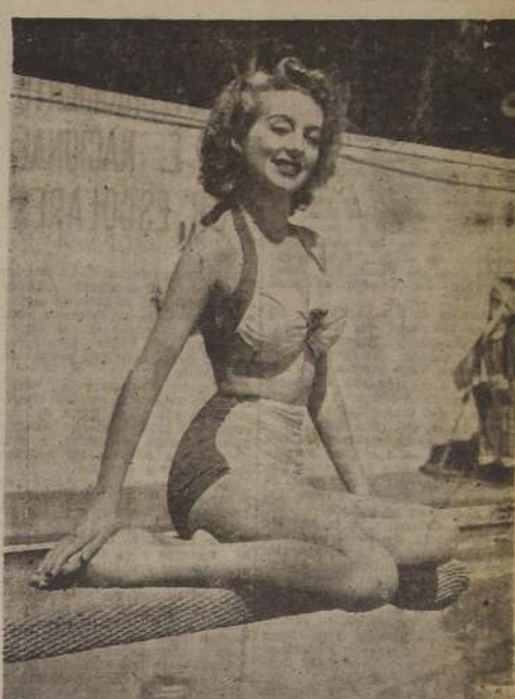
EVELYN KEYES, sufrió un accidente doméstico que la tuvo alejada del set por algunos días. Felizmente, para tranquilidad de sus muchos admiradores, ya se encuentra restablecida.

—David Niven se propone pasar unas largas vacaciones dedicadas a la pesca en alta mar. Establecerá su cuartel general en las Islas Barbadas, junto con su esposa y algunos amigos íntimos; pero para que lleguen esas vacaciones tendrá que terminar antes la labor en la nueva versión de "Pimpinela Escarlata".