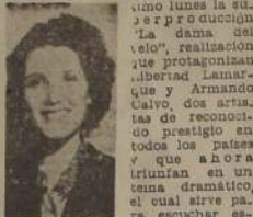
L. Lamarque cogida en una escena musical.

En la tarde de ayer hemos sabido que la Compañía Chilena de Espectáculos y la distribuidora Películas Mexicanas (Chile) Cia. Ltda., han tomado el acuerdo de estrenar el próximo lunes la siguiente producción "La dama del velo", realización que protagonizan Libertad Lamarque y Armando Calvo, dos artistas de reconocido prestigio en todos los países, que ahora triunfan en un cine dramático, el cual sirve para escuchar esta maravillosa música.