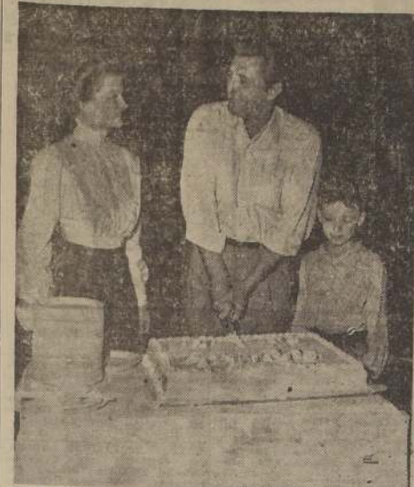
Robert Mitchum celebra su cumpleaños en el set de la Republic, durante su actuación en "Valle de ternura", basada en la novela de John Steinbeck, "The Red Pony". Mirna Loy y el pequeño actor Peter Miles le acompañan en su fiesta.

Interés por este certamen de LA NACION y Republic Films El estreno de la película "Valle de ternura", del sello Republic Pictures, que será presentada en el teatro Plaza, en fecha próxima, ha movido a la firma productora