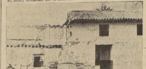
No se trata de las ruinas de un terremoto: es el interior del local de la Comisaría de Los Andes