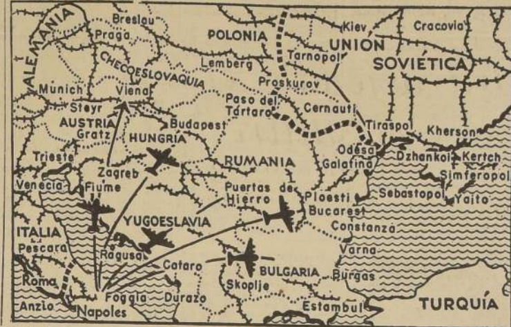
Desde las bases aéreas en Italia, los aliados pueden descargar violentos ataques al Este de Europa, como el descargado ayer, sobre Wiener Neustadt, en Austria