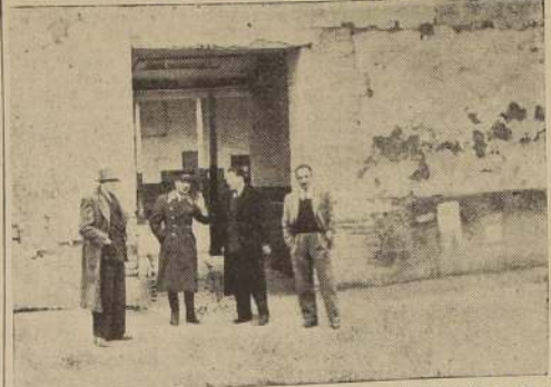
Fachada del ruinoso edificio que ocupa actualmente la Comisaría de Carabineros de Los Andes