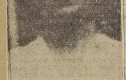
Doctora Olga Monetta O.

La doctora Monetta O. ha sido objeto de diversas manifestaciones de simpatía con motivo de su próximo viaje. Sus compañeros de trabajo la ofrecieron el viernes una comida en la Bahía; la Agrupación Médica Femenina la festejó con unas onces en el Hotel Savoy y las alumnas de la Escuela de Obstetricia realizaron un baile en su honor.