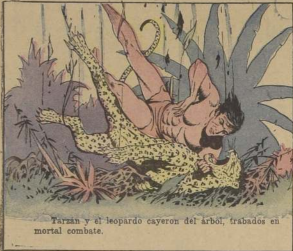
Tarzan y el leopardo cayeron del árbol, trabados en mortal combate.