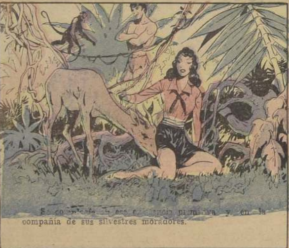
Se conocieron en ese momento y en la compañía de sus silvestres moradores.