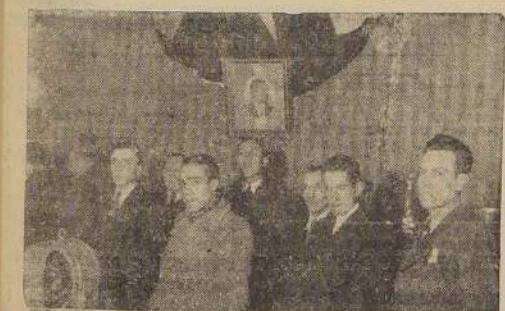
Parte de los asistentes a la inauguración

ALGUNOS DE LOS PRODUCTOS QUE HAN POPULARIZADO LA MARCA DE FÁBRICA "ROKOTE"