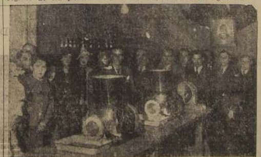
Un grupo de invitados observa el funcionamiento de una de las máquinas de la fábrica

MIEL DE PAPAYA. —Elaborada con papayas escogidas especialmente en La Serena está especialmente indicada para los pañuelos, los que adquieren con ella un sabor altamente agradable. Auxiliar inestimable para aderezar toda clase de postres. Como refresco, se puede tomar con agua, constituyendo una bebida inmejorable por su calidad. Favorece la secreción péptica del estómago y por esta causa, favorece la digestión.