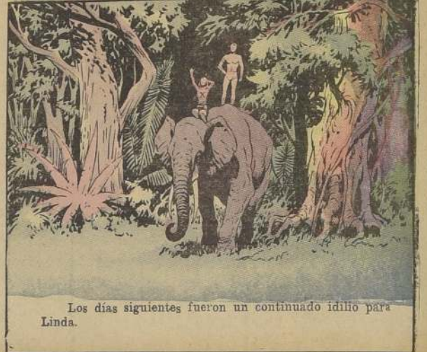
Los días siguientes fueron un continuado idilio para Linda.