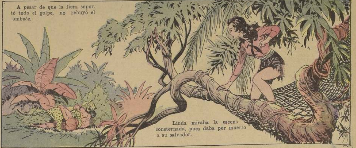
Linda miraba la escena consternada, pues daba por muerto a su salvador.