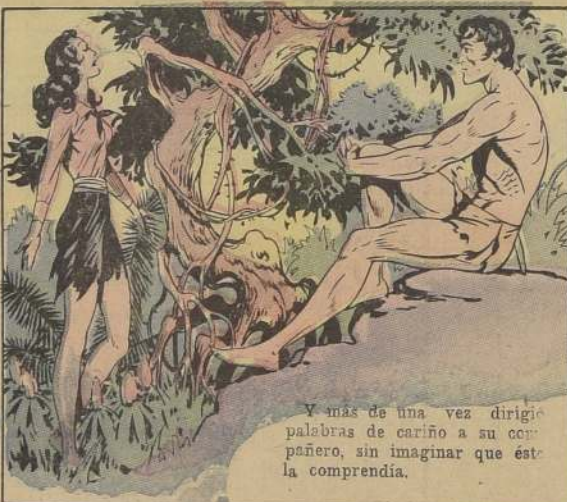
Y más de una vez dirigió palabras de cariño a su compañero, sin imaginar que éste la comprendía.