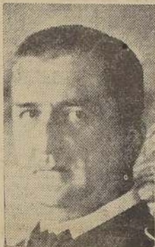
Almirante Horthy, Jefe de Estado de Hungría, cuyo aniversario celebra hoy la progresista nación del Danubio