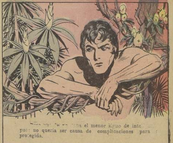
... el menor signo de interés, pues no quería ser causa de complicaciones para su protegida.