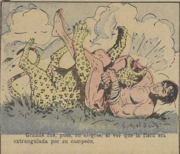
Grande fue, pues, su alegría, al ver que la fiera era estrangulada por su campeón.