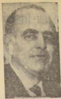
ROBERTO F. CHIARI