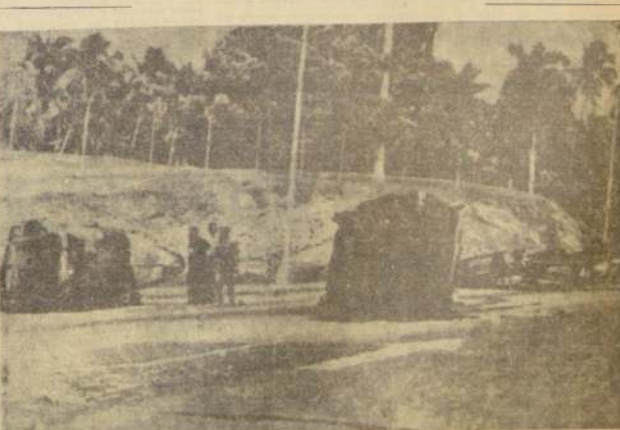
PANAMA.— Automóviles destruidos y volcados en la Avenida Presidente Kennedy de esta ciudad el 11, a raíz de los incidentes que comenzaron el 9; los vehículos destruidos son los que se suponían de norteamericanos como represalias de lo que los panameños

consideraron vejámenes por parte de los estudiantes norteamericanos contra la enseñanza nacional. Los incidentes y violencias continuaban ayer 12 en esta ciudad.