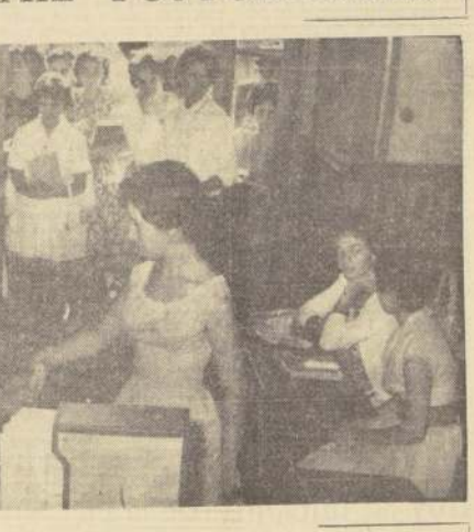
Cerca de 9.000 postulantes en todo el país iniciarán, a partir de las 8 horas de hoy, sus pruebas de bachillerato. Comenzarán con el examen de idioma extranjero, que este año por primera vez incluye el hebreo. En el grabado, una joven durante el sorteo, mientras sus compañeras esperan su turno.