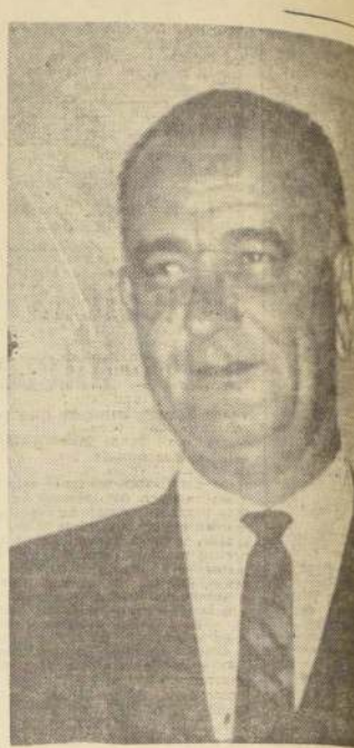
LYNDON JOHNSON fuerza, prosperidad y paz para el mundo.

Es casi seguro que la situación de Panamá servirá de motivo propiciatorio para alzar los odios contra el pueblo y el gobierno norteamericanos en una escala internacional sin precedentes. De allí que los funcionarios estadounidenses destacados en Panamá se encuentren discutiendo con sus colegas panameños to-