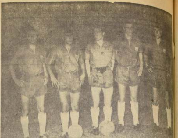
ATAQUE JUVENIL CHILENO, que ayer hizo un buen debut en el S. A. de Colombia. Empató a 1 con Uruguay, en un partido jugado en Medellín, donde abundaron las asperas. El cuadro nacional destacó por su buena técnica. Bravo, interior izquierdo de

Los futbolistas de la UC cumplieron en segunda presentación mañana, a las 17 horas, ante la selección de Los Angeles.