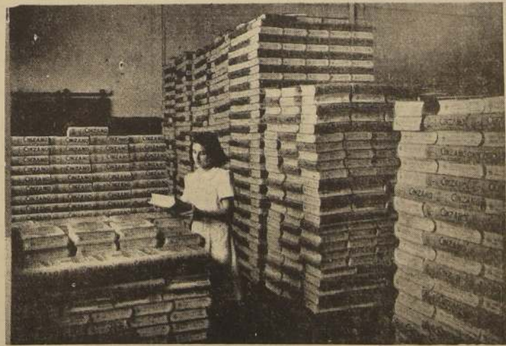
Vista de nuestro departamento de expedición

Los anuarios que forman esta montaña, llegarán hasta el más remoto rincón de América, proclamando el poderío del comercio e industria del continente