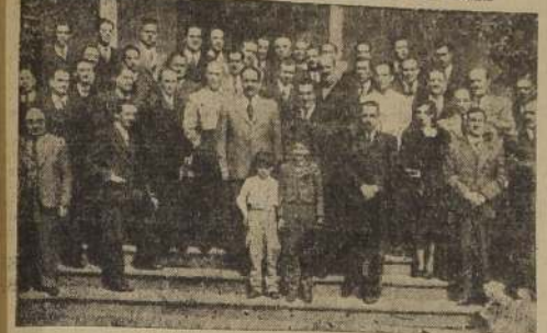
Parle de los asistentes a la fiesta

SIGNIFICATIVA CEREMONIA SE REALIZO EL SABADO ULTIMO EN EL PARQUE DE LA HACIENDA "SAN JOSE DE LAS CLARAS"