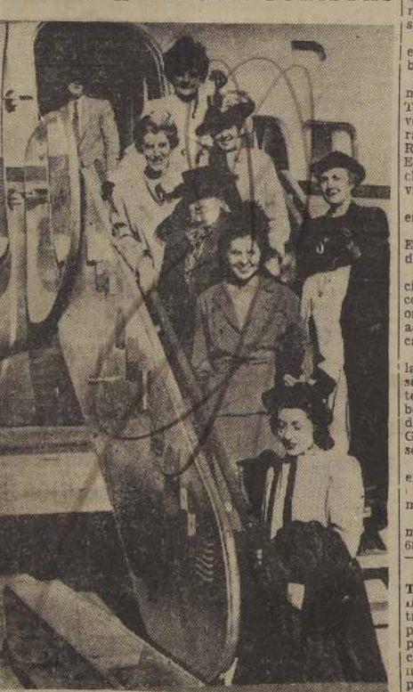
El grabado muestra un grupo de turistas norteamericanos llegados últimamente en el avión "El Interamericano", de la Panagra, precursores de numerosos turistas que visitarán escalonadamente el país.