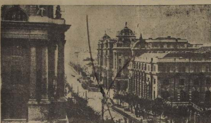
Belgrado, sede de la Conferencia del Danubio.