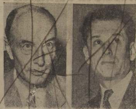
WASHINGTON.—El embajador soviético en Washington, Alexander S. Panyushkin (derecha), acusó a los Estados Unidos de estar aterrizando a los ciudadanos rusos que residen en este país, y pidió la entrega de la profesora rusa que huyó de la "protección" de la Oficina Federal de Investigaciones (FBI).— El embajador soviético fue recibido friamente por el Subsecretario de Estado, Robert A. Lovett (izquierda), cuando visitó a éste el 9 de agosto para hacer entrega de una nota oficial sobre el asunto de la desaparición de la profesora rusa.