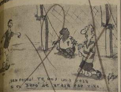
San Pedro: Te voy una vela y el zapo se atraja ese tiro.

Se jugará mañana en el Estadio Nacional ante miles de aficionados Momentos de interés y el programa