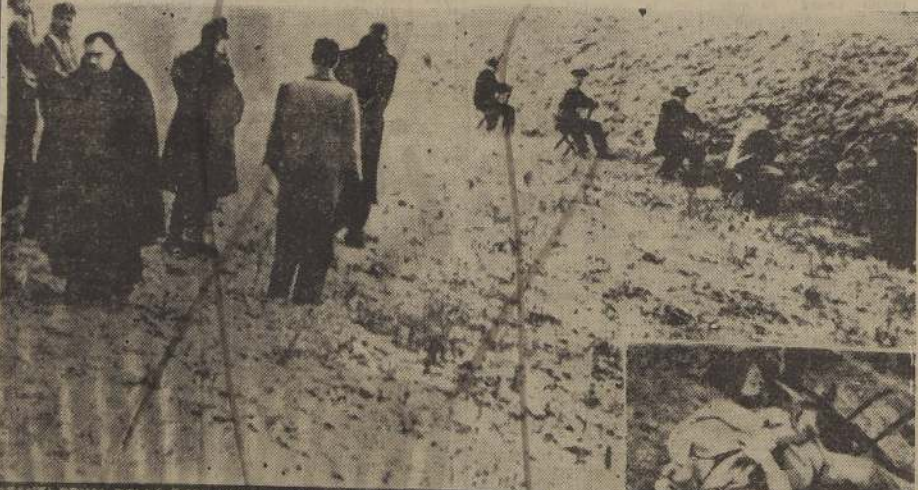
PRIMA DELLA FUCILAZIONE (CIANO E IL QUARTO DA SINISTRA)

VERONA (Italia). — El conde Galeazzo Ciano, que fuera Ministro de RR. EE. del Gobierno de Mussolini, yace muerto, y caído en la silla que estuvo sentada antes de ser fusilado (véase cuadro del ejemplar de hoy) de Mussolini, por haber conspirado contra el, después del armisticio italiano de 1943. En la fotografía superior, Ciano es el cuarto de la izquierda, que está mirando hacia atrás.