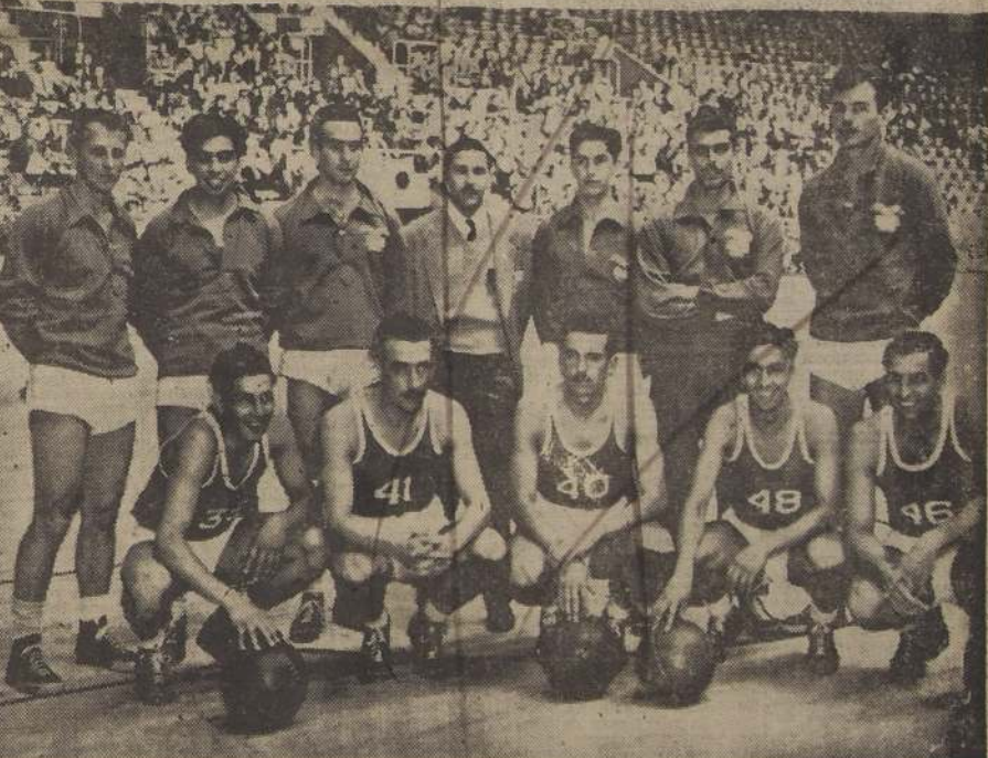
¡SEXTO! — Equipo de básquetbol de Chile que cumplió en la Olimpiada de Londres una sobresaliente actuación, como que se clasificó sexto en la competencia. — Ayer perdieron frente a Uruguay por 50-32 y tuvieron oportunidad de ascender un puesto. El deporte nacional se siente orgulloso de contar con tan destacados elementos. — (Foto ACME).