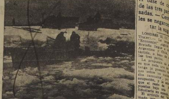
Un desembarco en la Antártida.