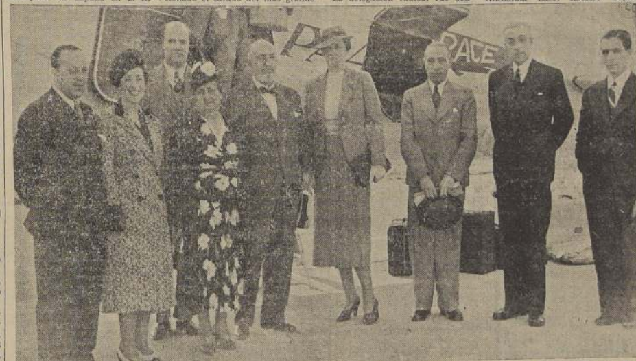
El Excmo. señor don Angel Ossorio y Gallardo y señora, miembro de la Embajada Extraordinaria de España, en el momento de llegar a "Los Cerrillos", donde fué recibido por representantes de la Embajada en Santiago.

El comité de recepción y homenajes a la embajada extraordinaria española a la transmisión del mando, se reunió ayer en la Embajada.