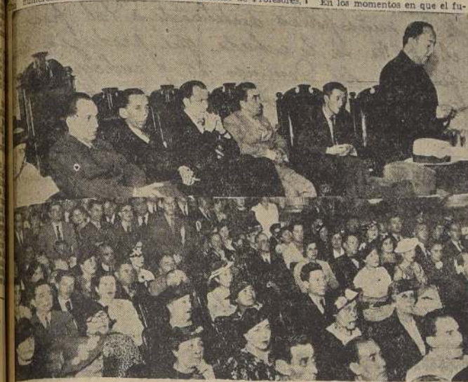
Directiva y parte de la concurrencia a la asamblea del magisterio celebrada ayer en el Salón de Honor de la Universidad de Chile.

Se refirió a la organización escolar vigente en sus diferentes aspectos; destacó la miseria material de las Escuelas y Liceos; destacó uno a uno los casos de persecución al magisterio por sus ideas políticas, y citó algunos hechos concretos, responsabilizando de ellos directamente a las autoridades del servicio.