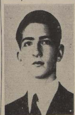
S. M. el Rey Pedro de Yugoslavia.