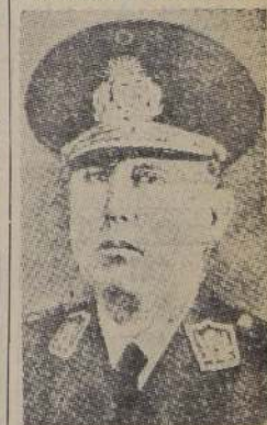
General Juan N. Tonazzi, Ministro de Guerra de la República Argentina.