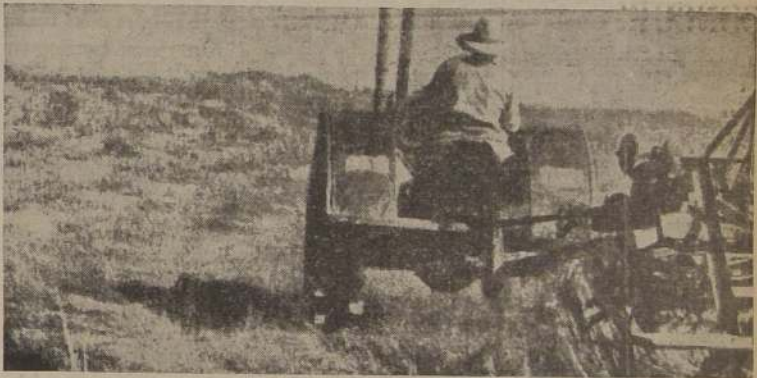
Arrancando lino textil con una máquina tirada por tractor

El lino se siembra a fines de invierno o a principios de la primavera, en líneas distantes 0,08 a 0,10 cms. entre sí.