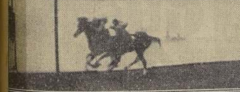
Oculto, da cuenta de Rendiña en el handicap de fondo

entre los 2 caballos en un rush impresionante. Frente a las populares, aún Oakland se mantenía en plaza, Norton ya en aquella altura, Norton continuó a desconfiar terreno en forma efectiva, mientras Pacasmayo decía agotado por el esfuerzo inicial, y siendo entonces substituido por Impetuoso. Pasando 200 metros para el disco, Norton dio alcance a Oakland, que opuso débil resistencia y allí la prueba pudo darse por terminada, pues el Milenko rumaba la distancia con gran coraje y se distanciaba por momentos del crack del Kangaroo, que ya estaba netamente batido. En los últimos metros, la prueba tuvo nueva emoción, pues cuando la gran contienda parecía terminada, surgió Impetuoso en seria arremetida y su nombre fue aclamado con entusiasmo por sus escasos partidarios.