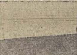
La debutante Como se Pide al freno delante de Bola de Oro y Tuyen

la tercera carrera, también para tres años, que no hubieran ganado. Este fue el mejor dividente de la tarde. Sin demora funcionaron las cintas y Mi Perilla se destacó al frente, seguido de cerca por Tala, quedando tercero Paracelso y más atrás Tala, Little Fool, Waldemar, La Chanson, Catita, Olimpio, Dionides y Papusa en lejano horizonte. A la altura de los novecientos metros, Soria se apareó a Mi Perilla, pero en la curva la yegua desapareció y Mi Perilla siguió en punta, perseguido entonces por Tala que atropelló por los palos y Paracelso que apareció por la tercera línea. Mi Perilla se defendió con grandes energías, pero no pudo evitar que en los tramos finales, Tala, lo dominara por media cabeza. El tercer lugar a un pescuezo, lo conservó Paracelso, próximo ganador y el cuarto, La Chanson, que cada día se ve peor. A un justificado reclamo de