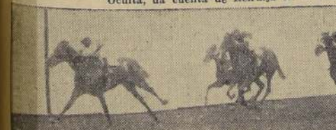
Happy Feet, aventaja a Tangee y Spear en la 2.ª carrera

campo abierto en un momento excepcional y los 5 rivales hicieron el punto a un tiempo. Pacasmayo, se destacó en la gozona, pequeño clito sobre Oakland y Norton, quedando cuarto Impetuoso, y al fondo Sucre. Cubiertos los primeros 200 metros, Oakland pasó resueltamente a la punta y sin estorbo aparente puso 2 cuerpos en cabeza sobre Pacasmayo, que precedía por escaso margen a Norton. Siempre Impetuoso seguía el cuarto lugar y cerrando la carrera, Sucre. A un tren endemoniado se cubrieron las primeras distan-