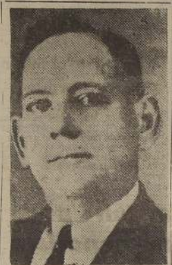
Presidente DIAZ AROSEMENA

Díaz Arosemena fue elegido Primer Vicepresidente de la República en 1932, y en 1935, pasó a la Presidencia, sin lograr éxito.