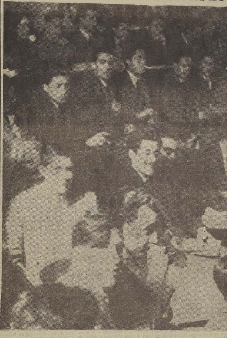
Una demostración gráfica de la normal asistencia a clases del estudiantado universitario, la captó ayer LA NACION, en la Escuela de Derecho de la Universidad de Chile, cuyos 950 alumnos asistieron a clases. El segundo año de la Escuela de Leyes, con una matrícula superior a los doscientos treinta alumnos fue enfocado en el momento en que asistía a una clase de Derecho Civil. Asimismo, los Liceos que fueron recorridos por LA NACION, demostraron la asistencia corriente del 90% del alumnado.

funcionarios pú- licos refuerzan desde acción del Comi- sariado