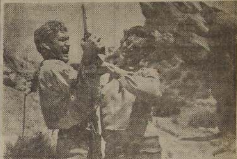
ROD CAMERON Y FORREST TUCKER, sostienen una feroz lucha para una de las escenas de "Los saqueadores".

El viernes será estrenado en el popular cine rotativo Roxy, la sala de las películas de acción, un nuevo film del sello Republic con la actuación descolante del galán Rod Cameron, el astro que se abre paso creando un nuevo tipo de intérpretes en este género de películas.