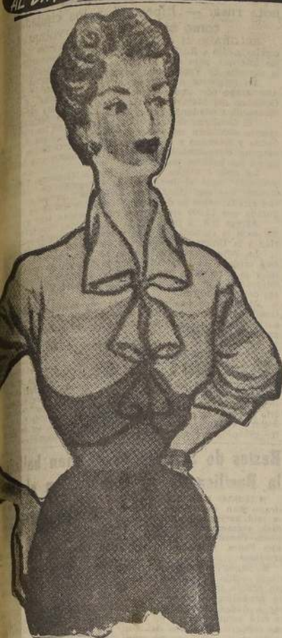
En cada doble que prolonga el alto cuello de esta color perla, forma un bonito detalle realizado con la pinta más obscura. Modelo novedoso y sentador.