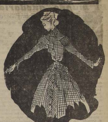
Los volados chatos sobre los... uñan una pequeña espina en este modelo, realizado en lana cuadrillé con grandes y cómodos bolsillos y falda muy amplia.

Los dietistas y especialistas en belleza femenina recomiendan el siguiente régimen alimenticio: DESAYUNO: Café con leche, pastelería hecha con manteca, azucarada. ALMUERZO: Sandwich de jamón sobre pan blanco. Pastelitos o empanaditas de carne, "Ice-cream" de chocolate. COMIDA: Crema de hongos, "Roastbeef" con puré de papas y coliflor. Panqueques o pastelería francesa. Café. Como vemos, el té de las cinco ha sido sacrificado. El almuerzo no ha sido copioso. La comida parece ser el tipo común. No figuran los temibles fideos, ni hay saladas ni platos de excesivo condimento, ni se insiste particularmente en los fritos. Sin embargo, no se incluyen elementos vitales, cuya falta hará que el cuerpo "hambre escondida", ello no impedirá que, además, la persona engorde.