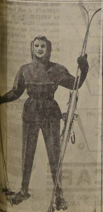
anorak de gabardina azul, pantalón gris claro, y guantes de una sola pieza con la cascaca — Modelo de París, de la Casa Carven —