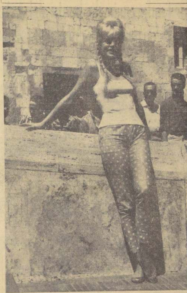
SPOLETO, Italia.— La rubia actriz francesa Brigitte Bardot usa un ajustado pantalón al estilo de Capri, mientras posa para los fotógrafos apoyándose provocativamente en una pared, durante su actual visita a Italia. La estrella ganó muchos admiradores en esta pequeña ciudad. (Foto UPI.)

4 mil personas amenazadas de envenenamiento Más de cuatro mil personas, además de una extensa zona agrícola y animales ovejunos, están en peligro de envenenamiento debido a las aguas o "torras" que se escurren desde la mina, mientras posa para los fotógrafos apoyándose provocativamente en una pared, durante su actual visita a Italia. La estrella ganó muchos admiradores en esta pequeña ciudad. (Foto UPI.)