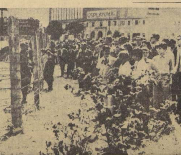
BERLIN.— Un grupo de berlineses occidentales se mofan de los guardias que patrullan la barricada de alambradas de púas que se levanta para cerrar la ruta de escape en el sector occidental. La policía y militares comunistas hicieron uso de sus tanques para poder dispersar a la multitud de berlineses orientales que protestaban por el cierre de la ruta.