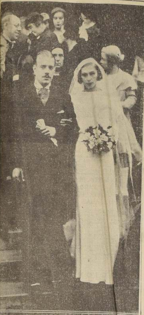
Los novios saliendo de la Iglesia Parroquial de los Horros