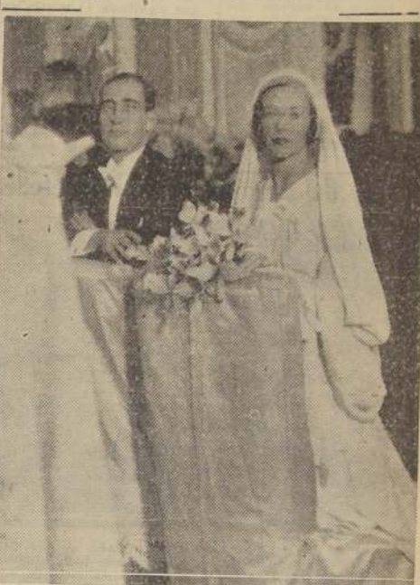
Los novios durante la ceremonia religiosa