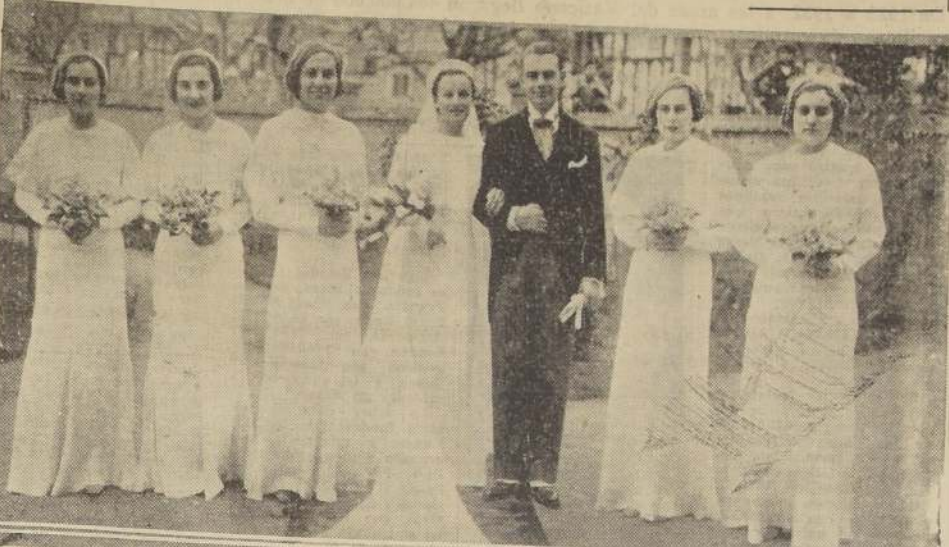
Los novios rodeados de sus damas de honor después de efectuada la boda. Por la tarde se realizó una gran recepción en casa de la novia, a la que concurren destacadas familias de la sociedad porteña y de la capital