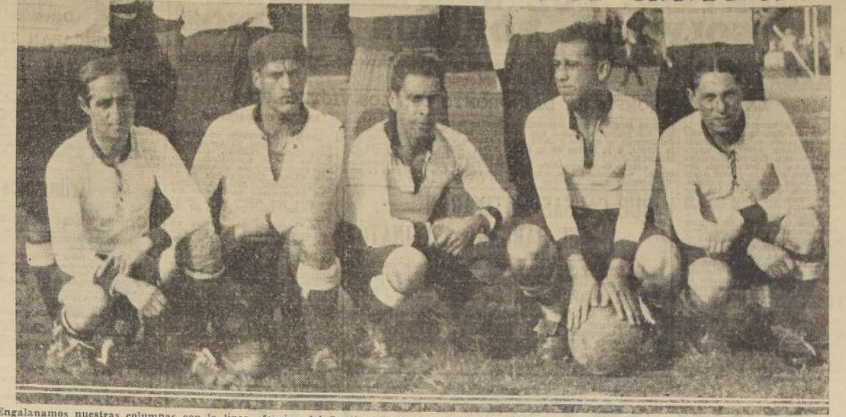
Engalanamos nuestras columnas con la línea ofensiva del Santiago F. C., el domingo último, campeón del torneo de apertura de la sección profesional de la Asociación de Fútbol de Santiago. Está integrada por los jugadores Moreno, Gálvez, Hidalgo, Ortiz y Molina.