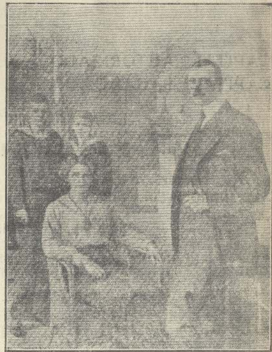
El rey Cristián X, la reina Alejandrina y sus hijos los príncipes Federico y Knud, en su nuevo castillo de Skagen.

París ha recibido en su seno a los soberanos de Dinamarca, el rey Cristián X y la reina Alejandrina. Hijo del rey Federico VIII, muerto en dramáticas circunstancias en Hamburgo, el año 1912, después de seis años de reinado, el rey Cristián X es nieto del rey-patriarca Cristián IX, y por lo tanto sobrino de la ex-emperatriz de Rusia, María Federowna. Por su madre, la princesa Luisa de Suecia, lleva en sus venas sangre francesa, siendo descendiente de Bernadotte. Por otra parte, su bisabuela era una Beauharnais. Annuales, también, y vivas simpáticas unen a la reina Alejandrina con Francia. Su padre, el gran duque Francisco III de Mecklemburgo-Schwerin, pasó en Francia los últimos años de su vida y en Cannes fué donde se efectuó el matrimonio de la joven princesa Alejandrina con el futuro rey de Dinamarca. La corte danesa es desde hace mucho legendaria por la vida simple y familiar que en ella se lleva. No era allí donde iban gustosos a reposar de sus arduos labores los soberanos cargados con más pesadas tareas: el czar Alejandro y la emperatriz María, su mujer; la reina Alejandrina, nacida también princesa de Dinamarca, y aún el mismo czar actual. Nuestro grabado representa al rey Cristián X y a la reina con sus hijos, en el nuevo castillo de Skagen y en el se puede atestiguar que las tradicionales costumbres de la corte danesa han sido conservadas por ellos.