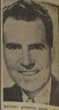
NIXON: prometió ayuda a Birmania.

La noticia de que Yugoslavia había aceptado la idea de llegar a una conferencia paritaria.