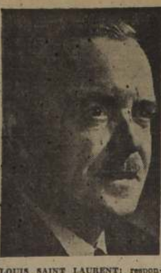
LOUIS SAINT LAURENT, responsable a Estados Unidos sobre acusaciones de espionaje.