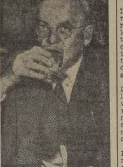
FOSTER DULLES: fue apresurado al desarme de Japón.

sabía sobre una petición elevada a la Comisión por 20 norteamericanos que se niegan a su repatriación, y que se encuentran internados en la zona desmilitarizada.