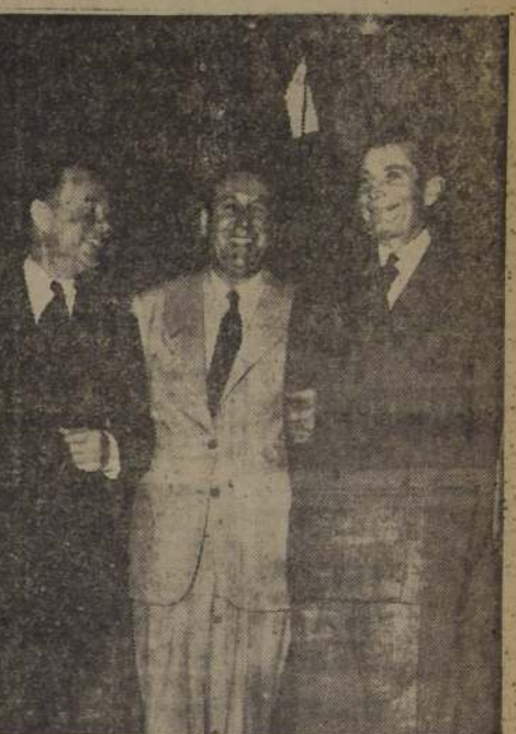
PERIODISTAS NORTeamERICANOS VISITAN AL PRESIDENTE PERON.— BUENOS AIRES.— La foto muestra al Presidente de Argentina, General Juan Perón acompañado de los periodistas norteamericanos Fred Strozner (a la izquierda) y Lloyd Stratton (a la derecha), correspondientes en Buenos Aires y General de The Associated Press, respectivamente, durante la visita que hicieron a la Casa Rosada para presentar sus saludos al Primer Mandatario argentino.

El documento informa que las utilidades líquidas brutas de este período se elevaron a 815 millones de nacionales, que se destinaron a la reserva, provisiones, contribuciones y otros rubros. Finalmente se refiere a las perspectivas económicas, subrayando que merced al aumento de las exportaciones, se permitirá acrecentar las importaciones requeridas para el desarrollo del país; modificará los saldos de cuenta de algunos convenios comerciales y reforzará las tendencias de oro y divisas para afianzar la posición económica del país.