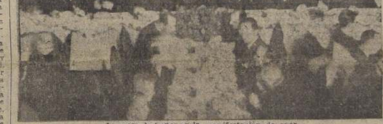
La mesa de honor en la manifestación de ayer