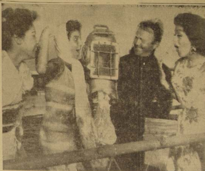
PALOS VERDES, California.— Miss Puerto Rico, Miss Japon y Miss Venezuela, aparecen en esta radiofoto, durante la visita que hicieron a Mariland. Las tres bellezas están compitiendo en el torneo de Los Angeles.

"Los gobernantes rusos se hallan ante el riesgo de un levantamiento y, a la larga, de la irresistible demanda del pueblo de mayor seguridad personal, más libertad personal y mayor disfrute del producto de su trabajo. El grupo gobernante, el Presidium, a la sazón con 11 miembros con voto, estaba radicalmente dividido en cuanto a la forma de hacer frente a la situación".