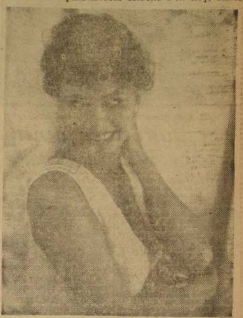
SOPHIA LOREN, la escultural actriz del cine italiano que hoy veremos en "La Estatua Desnuda", en la maravillosa producción Fox en Cinemascope.