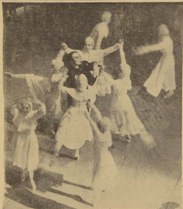
UNA ESCENA DEL PRIMER CUADRO del ballet "Paganini", de Sergio Rachmaninoff, presentado por el Ballet Clásico Nacional Sulima en el Teatro Municipal. Al centro, aparece Dmitry Rostoff, el famoso bailarín ruso que creara este papel en Londres (1929), según la coreografía original de Michel Fokine.