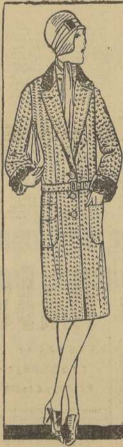
Este abrigo confeccionado en rico casimir inglés de pura lana . . . . . $