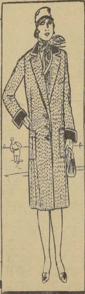
Este abrigo confeccionado en rico genero de alta fantasia. En todos los tamaños . . . . . $