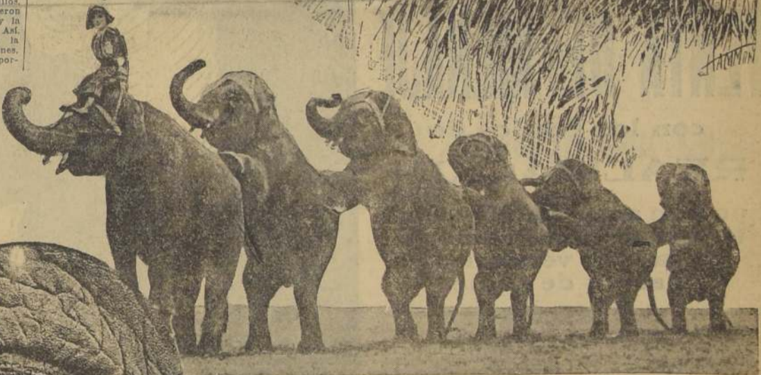
Los seis compañeros de Diamante Negro que debían cumplir la "triste" misión de estranguilar a su camarada de circo.

Primeramente se pensó extranguilar a Diamante Negro. Para ello se daría una vuelta al rededor del cuello con una gruesa cadena, a cuyos extremos se atarían a seis elefantes, que arrastrarían hacia su lado con todas sus fuerzas. Este proyecto fué abandonado y también el de la electrocución.