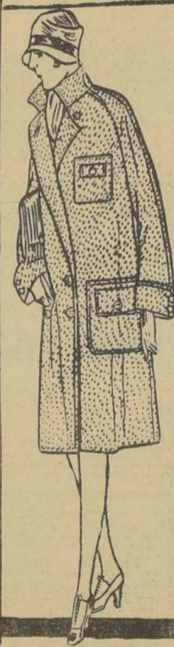
Este abrigo confeccionado en mullón de pura lana, especial para viaje y playa . . . . . $