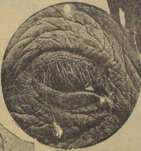
El ojo malicioso y picareasco de un elefante, que, aunque pequeño, le basta y sobra para su vida y le da una expresión única. En el reflejo el gigantesco paquidermo su bondad y su ferocidad.

En aquel pequeño mundo que cabía dentro de la gran carpa del circo, Diamante Negro era el fa-