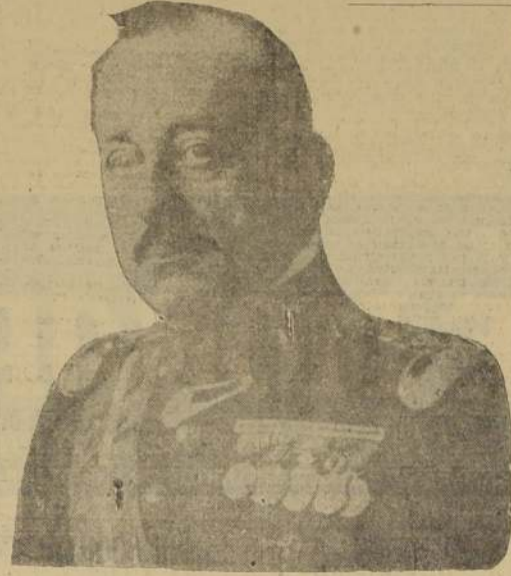
Primo de Rivera

EL REY ALFONSO ACEPTO LA RENUNCIA Y DESIGNO AL GENERAL DAMASO BERENGUER PARA QUE FORME EL GABINETE.— EL MARQUES DE ESTELLA PUSO EN CONOCIMIENTO DEL SOBERANO SU DECISION DURANTE UNA VISITA QUE LE HIZO EN PALACIO.— EL PREMIER DIO COMO CAUSA DE SU RESOLUCION EL ESTADO DE SU SALUD.— SE CREE QUE EL GENERAL BERENGUER TENDRA ORGANIZADO HOY EL MINISTERIO