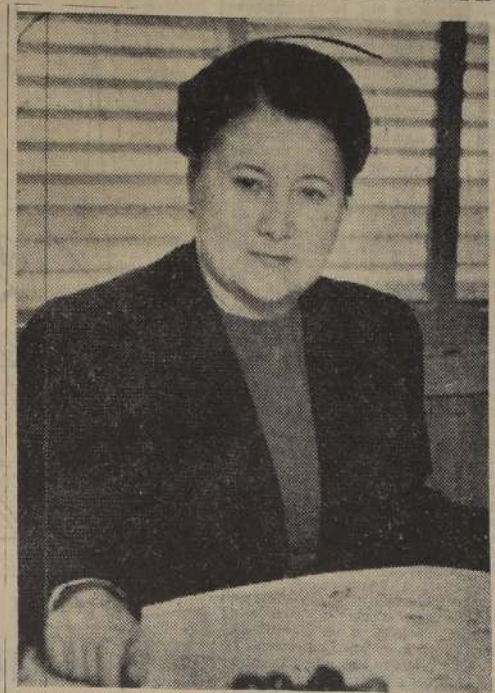
LLAMADO A LAS MADRES DE CHILE.— Un emocionado Mensaje de Navidad a todas las madres de Chile, transmitió anoche, por cadena radial, la Primera Dama, fortaleciendo la fe en los grandes destinos de la patria.