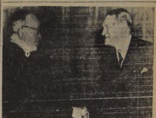
PARIS, 24.— El electo Presidente de Francia, René Coty (a la izquierda) es felicitado cordialmente por su antecesor, Vincent Auriol, momentos después de conocerse el resultado oficial de la decimotercera votación en el Parlamento.

LA NACION. — Viernes 25 diciembre 1953—9