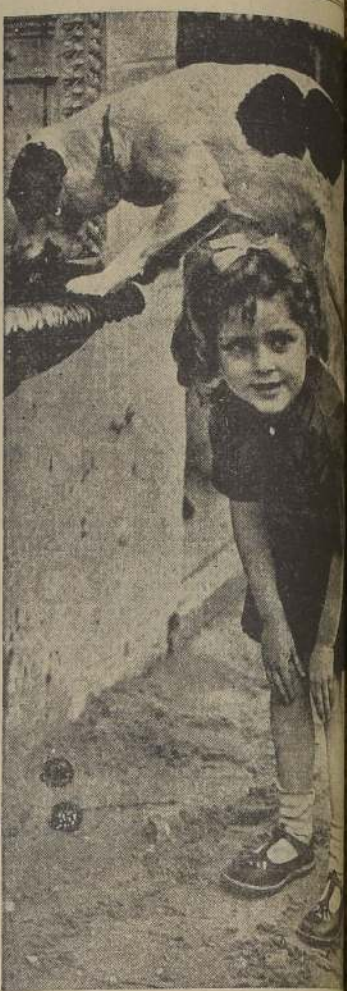
Curiosa fotografía en que una niña ayuda a un perro para que coja algo que no alcanzaba a su boca. Se justifica la frase de "amigos en la necesidad".