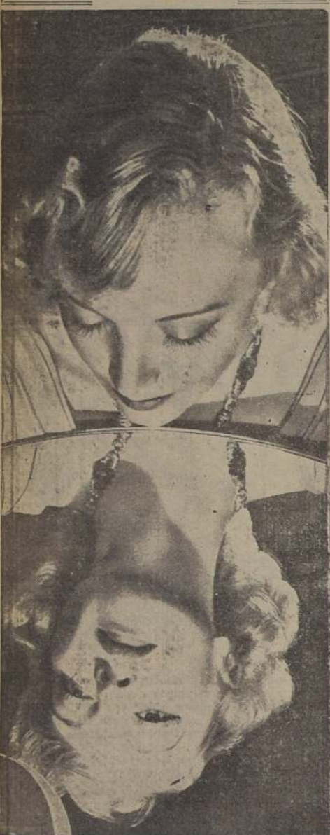
¿Cuál es más bella: la Virginia Bruce inclinada sobre el cristal, o su rostro reflejado en el espejo?