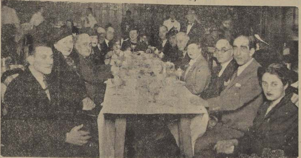
Miembros de la colonia portuguesa, que despidieron con un té, en el Tea Room de Gath y Chaves, al Ministro del Portugal y señora de Pedrosa, con motivo de su partida al Japon.