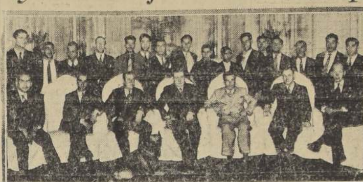
La delegación de Iquique en el salón de Honor del Palacio de la Moneda, durante la audiencia que le concedió a mediodía de ayer S. E. el Presidente de la República

En audiencia especial, felicitó a los campeones. Accedió a la petición de mejoramiento del Estadio AGRACEDIDOS