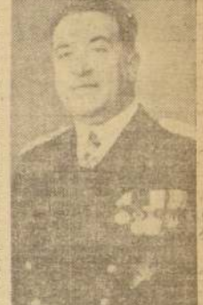
General FAWZI CHEHAB, que hoy asume la Primera Magistratura de El Líbano.