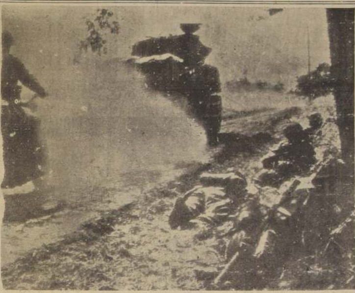
Un tanque Sherman seguido por un mensajero pasan al lado de soldados de la infantería británica, que defienden una posición en un camino entre Tilly y Caen.

Este nuevo éxito de las armas rusas fue proclamado esta tarde por Stalin en una orden del día dirigida al general Yeremenko. Dice que "Las tropas del Segundo Frente del Báltico, habiendo pasado a la ofensiva en