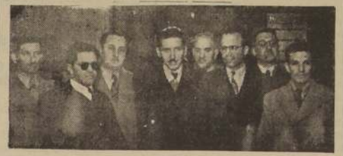
El directorio de la Asociación de Educadores de Enseñanza Industrial y Minera, en su visita que hizo ayer a LA NACION

Ayer celebró sesión la Asociación de Educadores de Enseñanza Industrial y Minera, con el propósito de discutir los problemas de la enseñanza de la industria y la minería. Se trató ampliamente sobre la reforma de la enseñanza de la industria y la minería, y se acordó que el directorio de esta institución, en sesión extraordinaria en M. Rodríguez 679 a las 17 horas, en el fin de adelantar el estudio a que están abocados las comisiones y darle una solución final aprovechando la etapa de los numerosos delegados que hay en Santiago de las Escuelas de provincia.