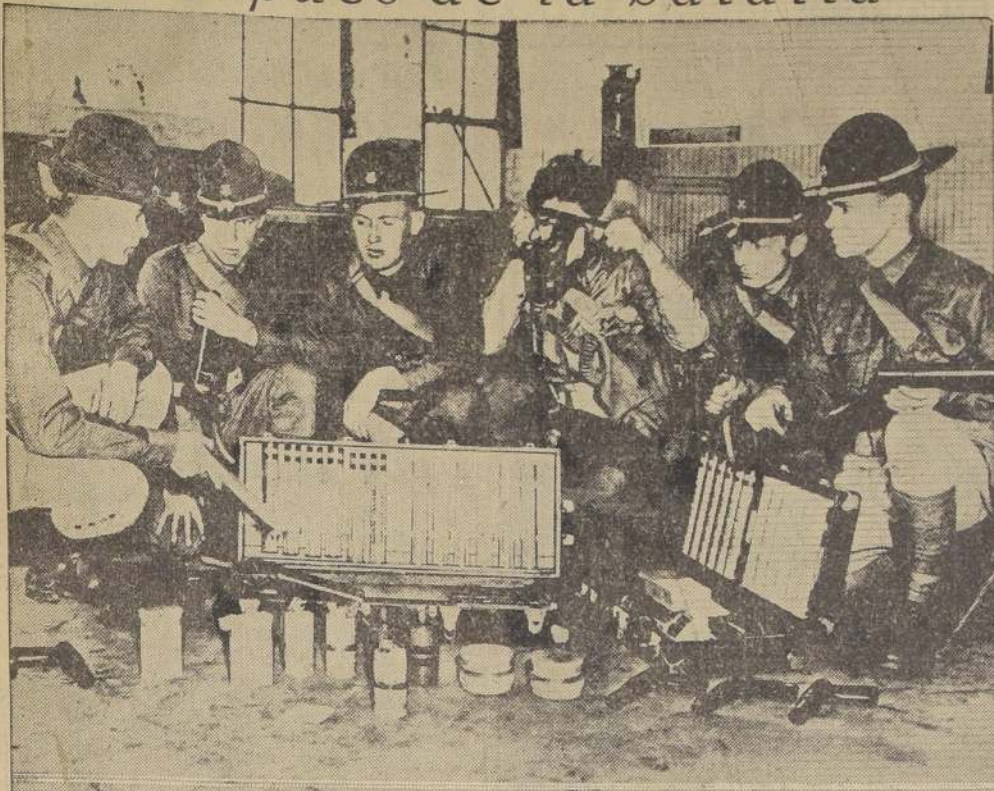
Los miembros de la guardia nacional de Minneapolis, hacen un minucioso examen del equipo de bombas ligeras, después de una fiera batalla entre huelguistas y policías, en la que resultaron lesionados por ambas partes. Mediante un acuerdo llevado a cabo oportunamente por los árbitros, se consiguió una tregua indefinida de las hostilidades.