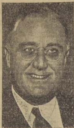
Roosevelt que mañana inicia su viaje al Caribe y Hawaii