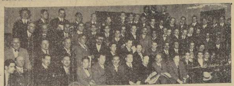
Asistentes a la manifestación

Se efectuó, a mediados de ayer, el local social de los Empleados Particulares, con motivo de su día onomástico.