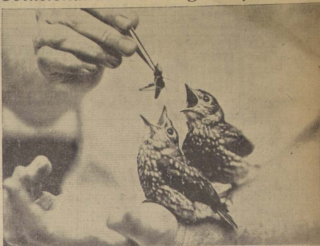
Muerta la madre de estas pequeñas avecinillas, hay una mano paternal que cuida de ellas, y con igual maestría, les da el alimento cotidiano. El MENU para el desayuno ha sido preparado con la misma prolijidad con que lo haría una madre para sus hijos.