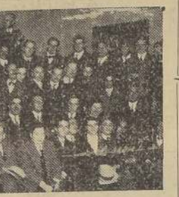
Asistentes a la manifestación

Se efectuó, a mediados de ayer, el local social de los Empleados Particulares, con motivo de su día onomástico.