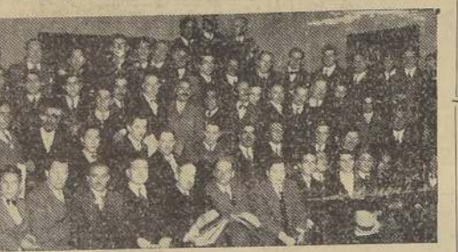
Asistentes a la manifestación

Se efectuó, a mediados de ayer, el local social de los Empleados Particulares, con motivo de su día onomástico.