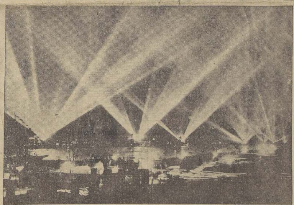
Unidades de guerra de la Armada de los Estados Unidos surtas en la rada de Nueva York, imponen la potencialidad luminosa de sus reflectores, frente a la trepidante ciudad de Manhattan. Esta fotografía fue tomada durante la visita del Presidente Roosevelt, que pasó revista a dichos buques.