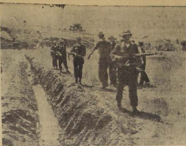
KHAN YOUNIS (Francia de Gasa).—Tropas de la Fuerza de Emergencia de las Naciones Unidas, aparecen aquí patrullando junto a la línea de demarcación. (RADIOFOTO, UNITED PRESS).

ración y recalca que Francia ha prometido apoyo aéreo al ejército israelí en caso de nuevas dificultades con los árabes y que ha notificado a Estados Unidos en tal sentido. "France-Observateur", agrega que el departamento de Estado norteamericano hizo fuertes presentaciones al Embajador francés en Washington, Herve Alphand, pero que Pineau envió un memorándum al Departamento de Estado, para suavizar la actitud del Departamento. El portavoz también negó rotundamente que fueran ciertas las revelaciones que aparecieron en un libro publicado esta mañana y en el cual los hermanos Merry y Serge Bromberger, conocidos comentaristas políticos, aseguran que Francia se puso de acuerdo con Israel para el ataque a Egipto, el año pasado. Son "puras invenciones", dijo el portavoz.