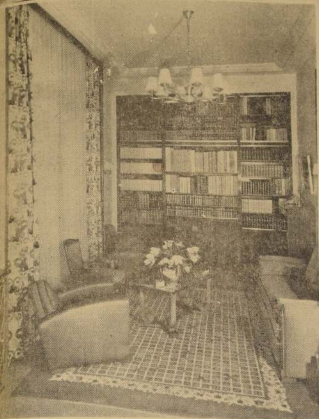
Decoración de una Biblioteca por LELE, París