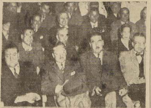
El doctor Salvador Allende y parte del público asistente al homenaje que se le rindió anoche

CONCURRIERON MINISTROS DE ESTADO, PERSONALIDADES Y NUMEROSO PUBLICO. — LOS ORADORES