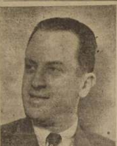
Don Osvaldo Illanes Benítez, Ministro de la I. Corte de Apelaciones de Santiago, cuyo interesante estudio sobre "Cursos especiales para jueces de crimen", presentado al Congreso Criminalístico, ha sido considerado por la unanimidad de los delegados concurrentes a este torneo, como uno de los trabajos más brillantes sometidos a su consideración.

yes o reglamentos sobre el porteo obligatorio de la Cédula de Identidad serán penados con multas o arrestos proporcionales a la gravedad de la infracción.