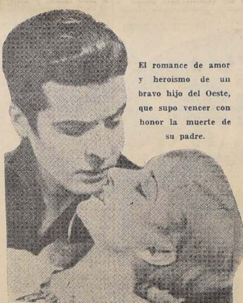
El romance de amor y heroísmo de un bravo hijo del Oeste, que supo vencer con honor la muerte de su padre.