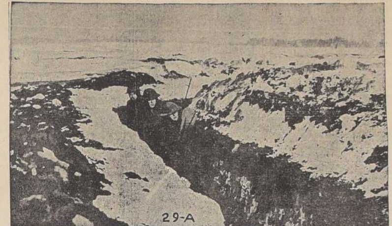
El invierno en las trincheras. La falta de ropas adecuadas aumentaba las penalidades de la tropa.

El problema de las condecoraciones era intrincado. Sólo tenía