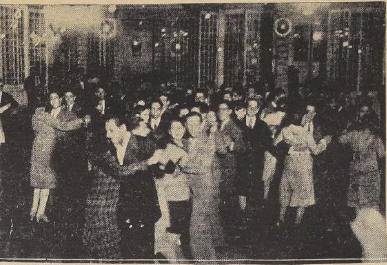
Durante el baile que este Sindicato ofreció en honor de "La Nación" y "Los Tiempos", en los salones de la Casa del Pueblo, el sábado pasado