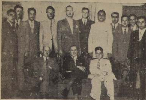
Delegación de la Escuela de Artes y Oficios que parte hoy al Brasil. Sentado, al centro, el señor Gabriel González Videla.