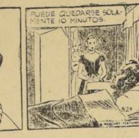
Por Chester Gould

LA RURAL, S. A. DE FERIAS. Transacciones efectuadas en nuestro remate del 4 de marzo de 1958.