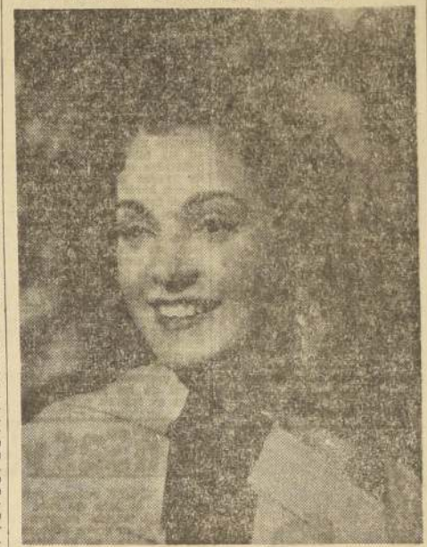
CARMEN SEVILLA, la encantadora estrella española, a quien hemos visto en numerosos films franceses, ha declarado en Madrid que está ansiosa de trabajar en el teatro junto a nuestro conocido Alberto Closas, quien se inició como actor aquí en Santiago junto a Margarita Xirgá.