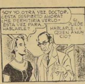
TARZAN - 5130

CURSOS Comerciales Platan, teleros, costura, modas, dictadura, geografía, aritmética, redacción, contabilidad. Preparamos rápidamente a secretarias, taquígrafas, dactilógrafas. "Instituto Femenino", San Antonio 78. (33) 24-3 P.