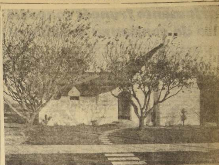
EL "HOME", EN LOS ESTADOS UNIDOS. — Otro lindo modelo de casita rodeada de jardines, y abierta, como todas las de este país, a la vida exterior, sin tapias ni verjas que son en absoluto desconocidas aquí.

Se trata de lo que podríamos definir como la exaltación del Provençal a una categoría que no desmiente su noble alcurnia provincial. Se ha respetado naturalmente, la fuente de inspiración y con ella lo más grato del estilo; solamente se ha hecho intervenir en la tapicería, en su color y en las maderas empleadas una cantidad de elementos que ratifican que el Provençal no es, por ser de provincias, un estilo rural, aunque algunas de sus variaciones lo sean; en este último caso, ahí están los diseños rústicos para confirmar tal cosa; y aquí las modernas creaciones, que podrían victoriosamente conquistar el París pasado —una vez más—, y que merecen sitio en