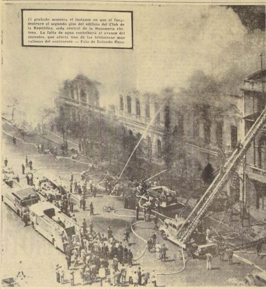
El grabado muestra el instante en que el fuego destruye el segundo piso del edificio del Club de la República, sede central de la masonería chilena. La falta de agua contribuyó al avance del siniestro, que afectó una de las bibliotecas más valiosas del continente.

El equipo de fútbol argentino San Lorenzo de Almagro venció hoy por tercera y última fecha del torneo cuadrangular, a Audax Italiano, campeón de Chile, por siete goles a uno. El primer tiempo terminó dos a cero. Tello marcó el único gol chileno a los 41 minutos del segundo tiempo.