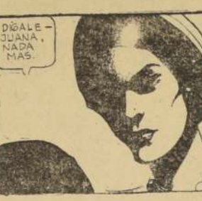
Por Edgar Rice Burroughs