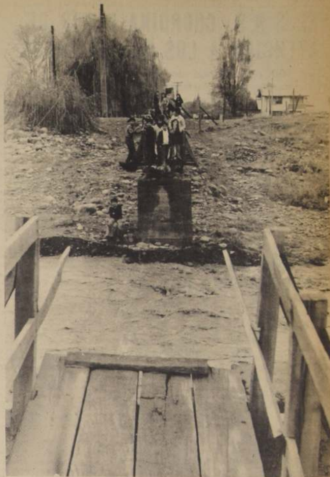
LOS VIOLENTOS temporales de los últimos días provocaron el destroz de uno de los puentes del río Mapocho. Esta situación impidió la normal movilización de los pobladores del lugar.