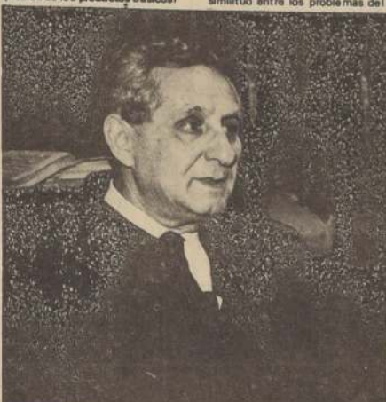
Si los flujos de palabras se pudieran transformar en flujos de agua para las zonas desérticas. El Embajador Extraordinario y Plenipotenciario de Israel, Gideón Rafael, Jefe de la Delegación israelita en UNCTAD III.