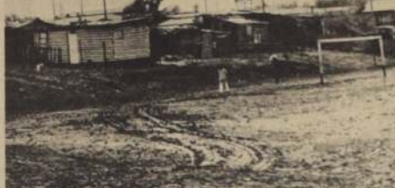
El Jefe del Estado, apenas conoció las proyecciones del impacto causado por las lluvias prolongadas, no sólo convocó al Consejo de Gabinete para considerar las medidas a tomar, sino que también visitó los sectores afectados. Entre ellos, los campamentos "Manuel Rodríguez" y "Luciano Cruz" y la Población "Tencha Bussi de Allende".