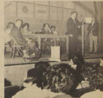
El Presidente del Comité Vecinal UNICOOP, del sector José María Caro, informa de los planes de trabajo. En el grabado, los demás miembros del Directorio y parte de los asistentes a la asamblea extraordinaria.