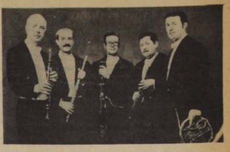
Quinteto de Vientos del Mozarteum Argentino