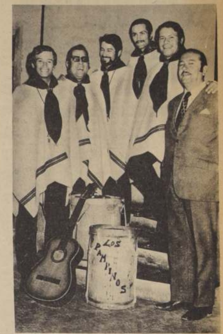
Los Pampinos: grabarán para Odeon.

Casa de la Cultura que está dando oportunidades a los hombres que laboran. No solo trabajo, también educación a todos los niveles. —¿... Y el futuro de ustedes...? —¿... grabar y volver a la mina. Solo hacemos esto por entretenerlos. Creemos que nuestra misión está en el norte... además la pampa cuesta dejarla. "Los Pampinos" pronto entregarán su trabajo. Es el esfuerzo de un grupo de trabajadores que ha tenido una oportunidad. Antes, las puertas, para ellos, estuvieron cerradas. Hoy, el trabajador está primero.