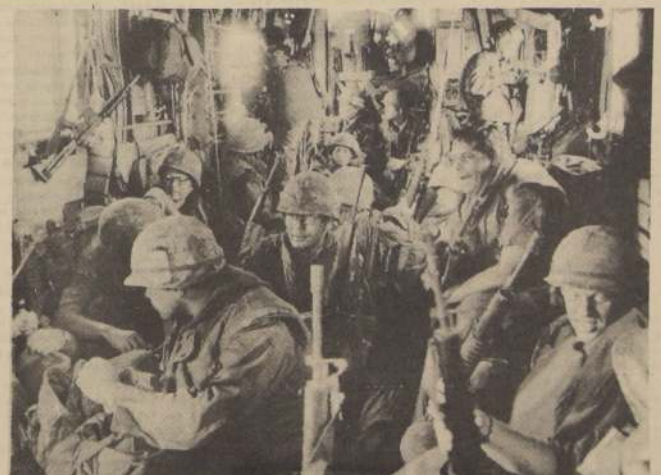
QUANG-TRI.— Restos del ejército norteamericano huye en uno de los llamados helicópteros gigantes. El pueblo norteamericano desfilará el próximo sábado en las calles, protestando contra algunas medidas del Gobierno de Nixon, que insiste en mantener la guerra más detestable de la historia.

La advertencia norteamericana hizo incapié en que la minas serán colocadas "en las aguas interiores y en las reivindicadas como territoriales", por el Vietnam del Norte.