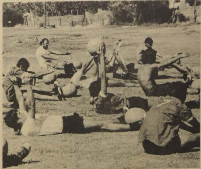
A pesar del estado de la cancha de Santa Rosa de Las Condes, Universidad Católica entrenó en forma normal.