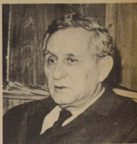
El Embajador Extraordinario y Plenipotenciario de Israel, Gideón Rafael, Jefe de la Delegación israelita en UNCTAD III.

—En Israel, hay gran aprecio por Chile y son muy respetadas las relaciones de todo tipo que tradicionalmente han unido a nuestros 2 países. La opinión pública de nuestra nación ve a Chile como a un país que nos comprende. Esperamos que las relaciones no queden donde están, sino que se desarrollen más aún y que se expresen en el proceso que vive nuestros dos países.