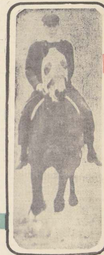
THE DRIZZLER: invicto, pero en el cespéd.