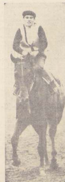
Simulado: un apronte récord.