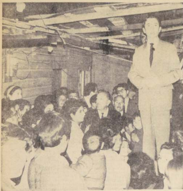
Juan Hamilton, Ministro de la Vivienda y Urbanismo, habla a los grupos familiares integrantes de la Cooperativa Autoconstrucción "Sandu". —San Miguel— que levantarán 240 casas, una escuela, sede social y áreas verdes, y fés agradece la confianza en los planes gubernamentales, a través del ahorro, como solución real a la vivienda propia.