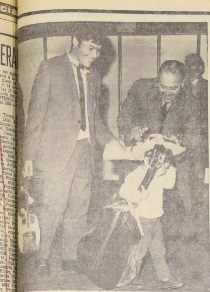
"CRUZ" y su hijo, con sombrero y guitarra mexicanas, Felices ambos.