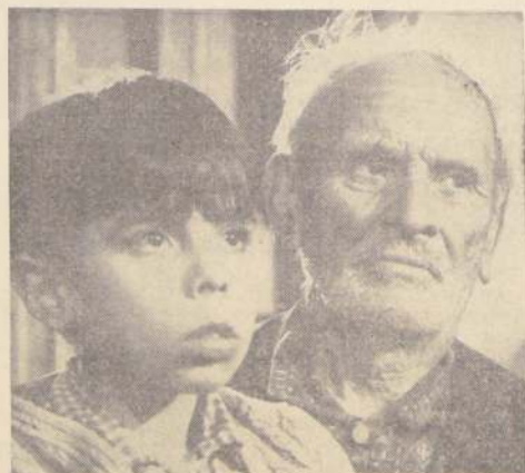
Escena de la película "Largo Viaje", de Patricio Kaulen, que se presentará el 2 de septiembre en el Instituto Chileno-Francés de Cultura.

cierto para instrumento de fibra", presentará su obra que será acompañada por cinco cortometrajes de animación y montaje: Viva la libertad y Electro-Show, de Patricio Guzmán; Cristal, de J. P. Danoso; Erase una vez, de Peter Chaskel y Luces para percusión, de René Korchner. Para este festival que durará dos semanas y cuenta con la gentil colaboración del Instituto Filmo de la Universidad Católica, Cineteca Universitaria, Boris Hardy y Patricio Kaulen, la entrada será gratuita y libre.