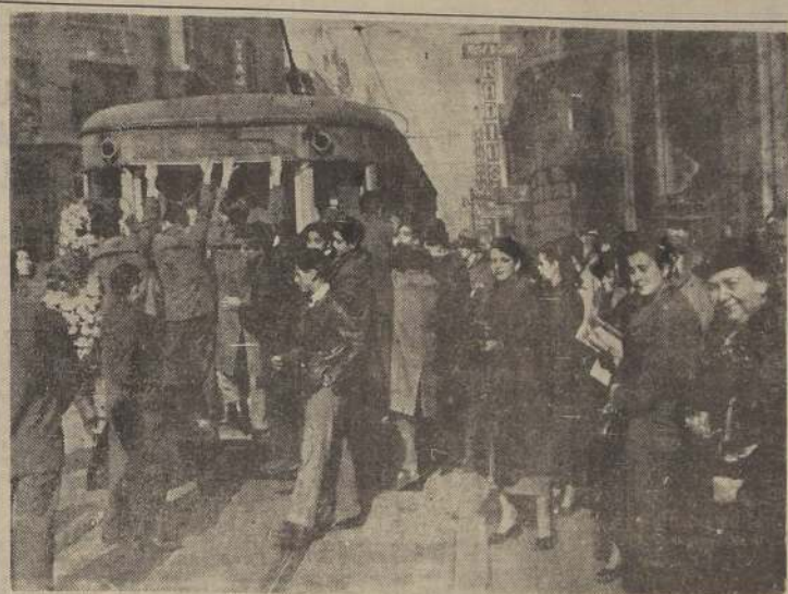
Los tranvías fueron materialmente asaltados por el público a mediodía de ayer, con motivo de la grave congestión que produjo la arbitraria huelga declarada por los personales de microbuses y autobuses. El Gobierno ha anunciado que hará respetar la libertad de trabajo y que adoptará las medidas tendientes a asegurar servicios de movilización. Esta escena fue captada en Bandera esquina de Agustinas.

LO ESPERA MUY CORDIALMENTE EL HOTEL PRAT (EX ASTURI) TAJAS REBAJADAS PREZAS CON BONO EXCLUSIVO DESDE $ 120.000.000.