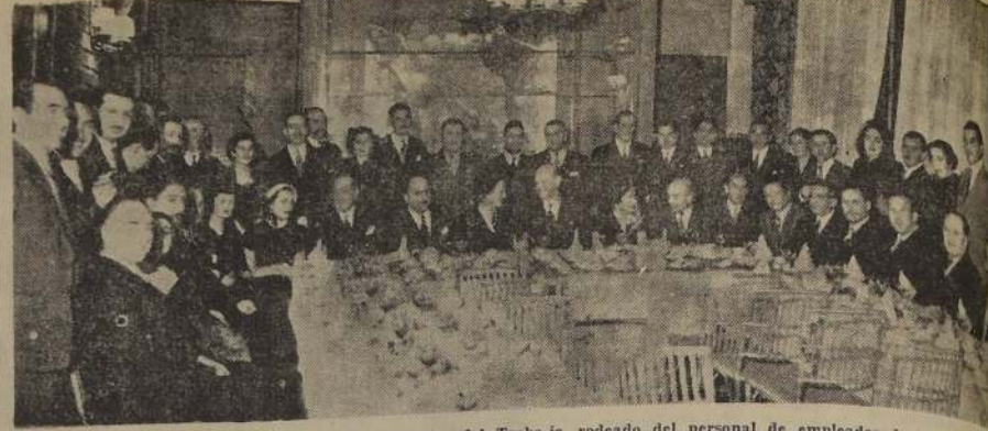
El Vicepresidente Ejecutivo de la Caja de Accidentes del Trabajo, rodeado del personal de empleados de la misma quienes le ofrecieron una comida en la Hostería Providencia, en días pasados, con motivo de su onomástico.