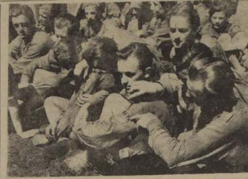
BERLIN. — Miembros de la Juventud Libre Alemana (Juventud Comunista Alemana) se despiden voluntariamente de sus insignias colocadas en uniformes que les impusieron los soviéticos, rechazando así simbólicamente las ideas comunistas. Alrededor de mil jóvenes que habían asistido el 28 de mayo a la gran concentración comunista del sector oriental de Berlín, se refugiaron en el lado occidental de la ex capital alemana, negándose a regresar a sus hogares del otro lado de Berlín oriental.

RELOJERIA "FONTENA" MORANDE 448 — Composura garantida de relojes en 24 horas. COMPLETO STOCK EN REPOSICION. ESPECIALIDAD EN CRONOMETROS. Atención esmerada para provincia. Absoluta seriedad.