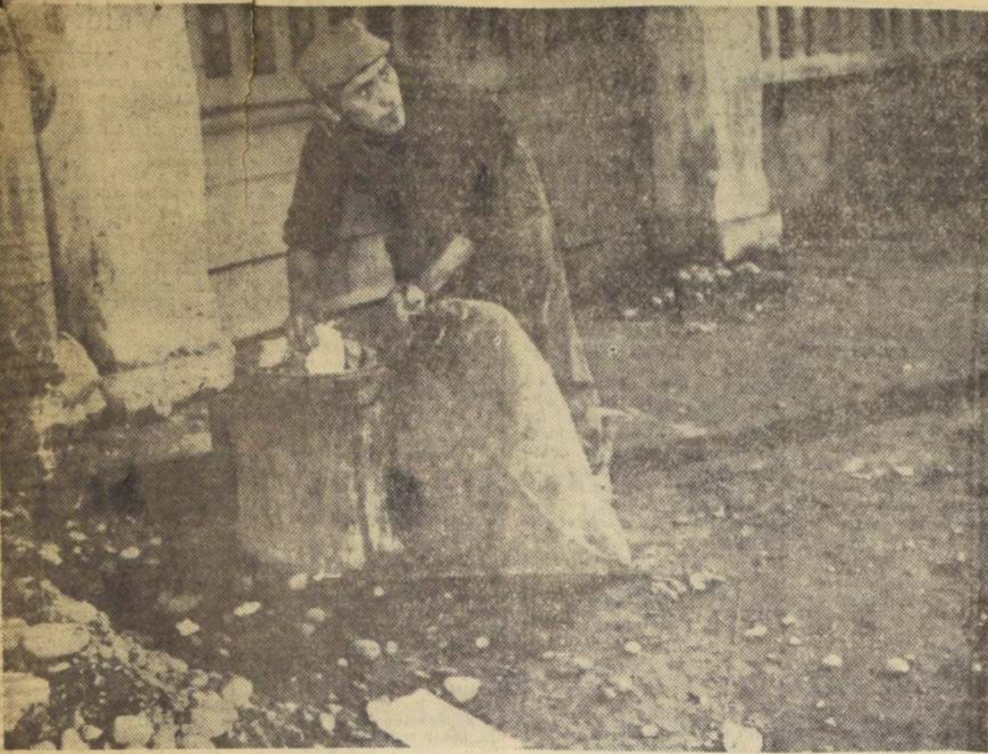
ESTE ES EL PROGRESO CON LA DINASTÍA PALESTRO — Según la dinastía Palestro, la comuna de San Miguel de los Encuentros de contarlos no solamente entre sus habitantes, sino al frente — en forma casi vitalicia — de la Alcaldía Municipal. Estos gentiles brindan a la colectividad sanmiguelina toda clase de confort, higiene y urbanismo. EN EL GRABADO, foto tomada al mediodía de ayer — con sol primaveral — en Gran Avenida a la altura del 4.000 — acerca — se observa cómo un "papelero" hurta en los tarros de basura su mercancía. El montón de tierra y piedras enojan el progreso estético de la vereda.