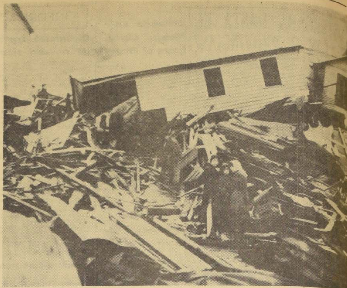
Los fenómenos sísmicos que han azotado el sur de Chile demuestran la necesidad de ir a una construcción, en la que debe darse la mayor importancia a la selección de los materiales, al refuerzo de sus fundamentos y planificación en cajón, tanto en la vertical como en la horizontal.

—o—o— Con frecuencia se presentan grietas en los muebles de madera. Para taparlas de modo que no se vean, se debe usar una pasta compuesta de cola y aserrín, de manera que formen una composición espesa, la que se hace entrar en presión en la grieta, se deja secar y posteriormente se lija y se procede a darle el color deseado con anilín.