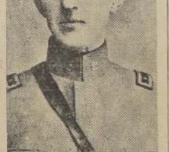
General Hans von Knauer

Al terminar su discurso el General von Knauer fué calurosamente aplaudido.