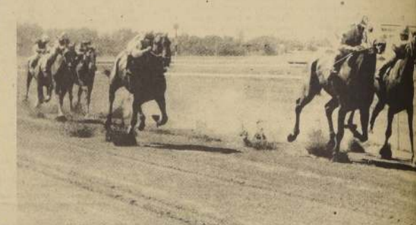
TUSREDA gana la prueba inicial del programa palmeño. Buen punto para la pupila del Nereida.

Muchas novedades para El Derby. Para empezar, Carlos Pezoa se decidió por El Tiron en lugar de Latino, al que muchos suponían con la monta del eficiente latigo. El Tiron trabajó ayer montado por Carlos González, en la pista viamarina. Pasó 700 metros en 43 segundos 2 quintos y luego de un descanso repitió esa distancia en 42" 2/5, últimos 200 en 12" 1/5. Un gran cotejo que demuestra totalmente recuperado al pupilo de Ernesto Inda Guzmán. Por su parte Tirola con Carlos Jorquera cubrió 600 metros en 37" 2/5 y repitió esa distancia en 36" 1/5. También aprontó Discipulo con Guillermo Pinto. Puso 1,04 para los 1.000 metros con 13" 2/5 para los últimos 200 metros. Este ejemplo será dirigido en El Derby por Sergio Azócar.