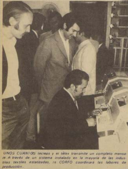
UNOS CUANTOS técnicos y el télex transmite un completo mensaje. A través de un sistema instalado en la mayoría de las industrias textiles estatizadas, la CORFO coordinará los labores de producción.

Este nuevo sistema de comunicación, que fue instalado por ENTEL y Correos de Chile, será atendido por personal chileno especializado y de ser óptimos los resultados, esta red se ampliará, conectando a todas las filiales e industrias a lo largo del país.