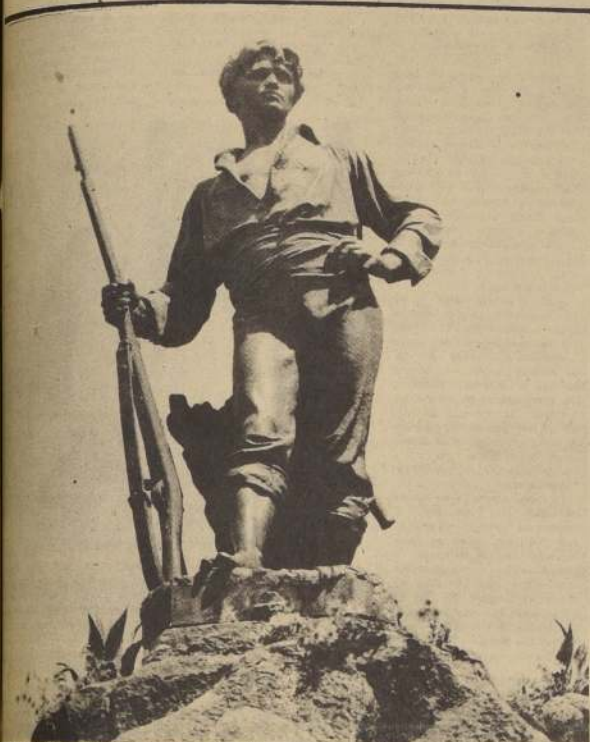
Monumento al "ROTO CHILENO", obra del autor Virgilio Arias, silueta de hierro y que simboliza al valiente hombre de las gestas chilenas que escribió las páginas más brillantes de nuestra historia. Hoy, 20 de enero, se recuerda aquel mismo día de 1839, fecha de la batalla de Yungay que culminó la campaña contra la Confederación Perú-Boliviana. En