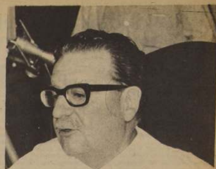
La ampliación de la base política del Gobierno con aquellos partidos que comparten el programa de la Unidad Popular, su estrategia y su táctica, anunció el Presidente de la República en su conferencia de prensa, ofrecida a los periodistas del sector Moneda. El Jefe del Estado dijo también que el Tribunal Constitucional había rechazado prácticamente todos los artículos de la Ley de Presupuestos desechados inconstitucionalmente por el Congreso.