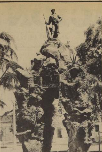
FRENTE AL MONUMENTO al Roto Chileno, ubicado en la Plaza Yungay, el Ejército chileno conmemora hoy el 132° aniversario de esa batalla que dio más gloria a nuestra Patria.

Respondiendo a una interrogación del representante de "El Mercurio" sobre la decisión del presidente norteamericano de tomar medidas con aquellos países que expropiaron monopolios de sus países, Allende dijo que partía de la base que el cable era auténtico y que expresa la opinión del Presidente Nixon. Crea, dijo, que los países pequeños, dependientes, como el nuestro, tienen derecho a que se les respete, que sus leyes, como el caso de Chile, han sido dictadas dentro de la Constitución, pueden reclamar dentro de su digni-