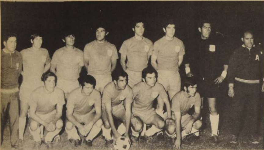
SELECCION DE MULCHEN, QUE CONSIGUIÓ SU PRIMER TRIUNFO DEL TORNEO AL GOLEAR A PUNTA ARENAS POR 5 TANTOS CONTRA 1. Los dos equipos sureños de la competencia son los de rendimiento más bajo.