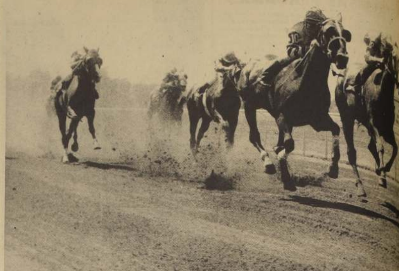
CARLOTITA supera con claridad a Enhuinchada en una prueba de 950 metros.

La combinación ganadora fue VIEL AMOUR EXACTO TAPALAPA Se acertaron 333 vales Cada uno cobró E° 755,90. El dividendo a segundo con Lord Soto fue acertado con 168 vales Cada vale cobró E° 373,60