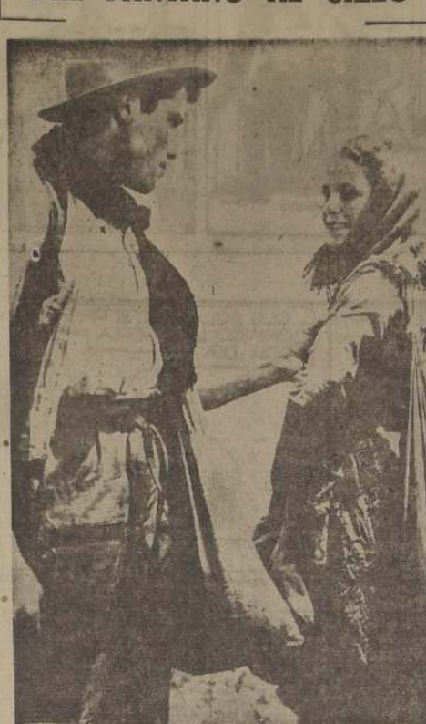
He aquí una escena del film "Del Pantano al Cielo", la cinta italiana que triunfa en la Plaza

Entra hoy a su segunda semana de exhibiciones la extraordinaria producción italiana "Del pantano al cielo", dirigida por Augusto Genina y que recoge la vida y la canonización de María Goretti, elevada a los altares católicos en 1930 por el actual Papa. Con rara uniformidad, puesto que siempre en materia cinematográfica las opiniones se dividen, la crítica ha saludado esta cinta como espectáculo de mérito y muy digno de verse.