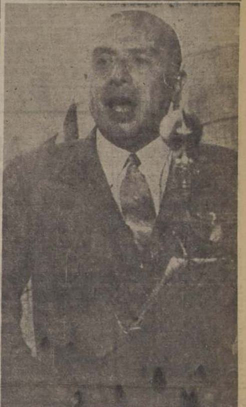
Excmo. señor Gabriel González Videla, que anoche, en un brillante discurso, dejó en claro que el Presidente Truman no ha interferido la política internacional de Chile, y que nuestro Gobierno está dispuesto a considerar una gestión directa con Bolivia, que considere también al Perú, de acuerdo con el Tratado de 1929.

Refiriéndose a mis palabras, manifestó textualmente que le agradaba "recordar nuestra conversación, en la que se contempló la utilización de las aguas de aquellos altos lagos ubicados entre Bolivia y Perú para hacer un vergel en la costa occidental de Sud América para Chile y Perú, y en compensación dar a Bolivia un puerto marítimo en el Pacífico". Era lógico que en mi viaje a