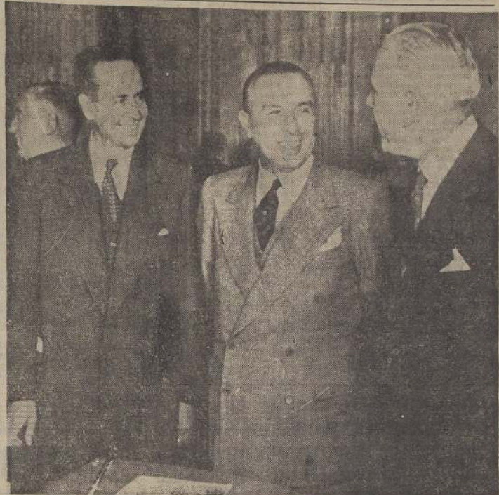
DESPUES DEL JURAMENTO DE QUINTANA BURGOS.— El Excmo. señor Gabriel González Videla quiso tomarse una fotografía con los señores Pedro Enrique Alfonso, ex Ministro del Interior, que aparece a su derecha, y el nuevo Ministro, don Alfonso Quintana Burgos. S. E. abrazó a ambos, deseando buena suerte al señor Quintana, y agradeciendo al señor Alfonso su colaboración de un año en el Gobierno.