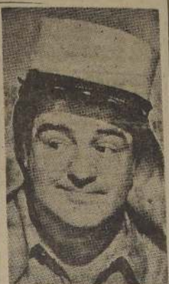
Clifton Webb, en "Más baratas por docena"

Por el año 1940, Bud Abbott y Lou Costello hicieron su aparición en el cine. Desde entonces, los dos cómicos han sido una de las parejas más populares del mundo. En esta película, los dos protagonistas se ven envueltos en una serie de aventuras que los llevará a lugares muy interesantes. La película es una obra maestra de la comedia y es una de las mejores que se han hecho en el cine. Los dos protagonistas son muy divertidos y hacen muchas bromas que los hacen muy populares. Esta película es una obra maestra de la comedia y es una de las mejores que se han hecho en el cine. Los dos protagonistas son muy divertidos y hacen muchas bromas que los hacen muy populares.