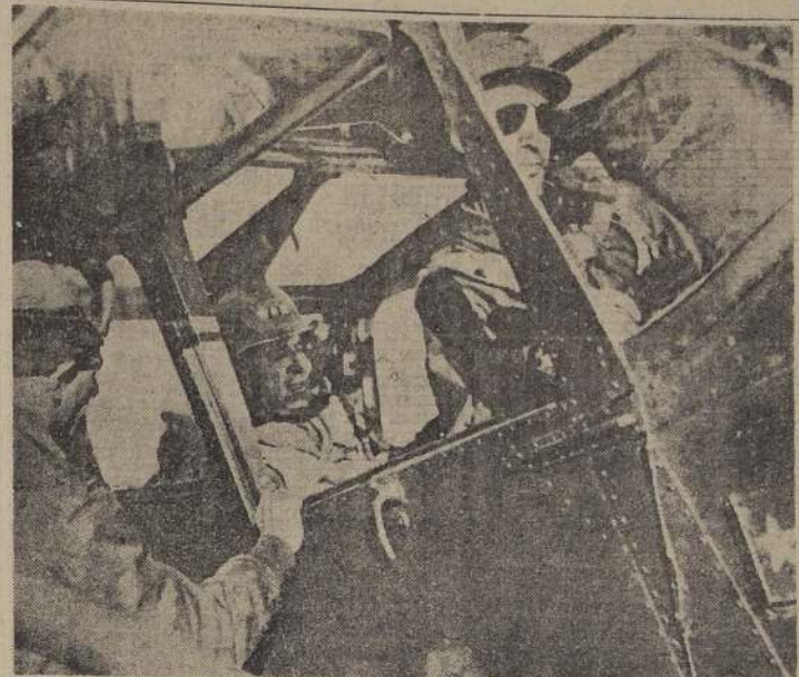
NUEVO COMANDANTE.— El Teniente General Matthew R. Ridgway, que en reemplazo del General Douglas Mac Arthur, asumió el cargo de Comandante en Jefe de las Fuerzas de las Naciones Unidas que luchan en Corea, aparece en la foto en los momentos en que se apresura a dirigirse desde su avión un ataque de paracaidistas en la zona de Munsan, cuando todavía era Comandante del 8.º Ejército Norteamericano.