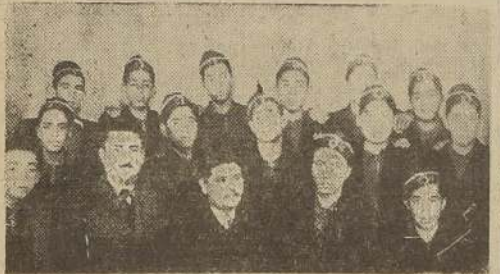
Alumnos de la Escuela-Granja de Cajón, que visitaron ayer LA NACION.

Como en años anteriores, el último curso de la Escuela Granja de Cajón (Temuco), realiza una jira de estudios por esta zona para recibir en el terreno mismo, lecciones prácticas de su especialidad. En esta ocasión alcanzaron a Valparaíso, San Felipe, Los Andes, y de regreso estarán en Molina, Longaví y Linares.