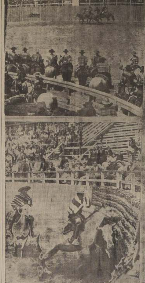
Una fama ya proverbial tiene el rodeo de San Fernando. Es una de las fiestas de destreza criolla, que simboliza de modo más significativo la tradición de la gente de campo. El huaso, el caballo, el rodeo, entonces, todos los paisajes y comunican al aire una vibración vital y optimista.

sucesos ocurrido el domingo se debió en gran parte a que las víctimas iban en estado inebriado. — (FLORES NEIRA, Correspondiente).