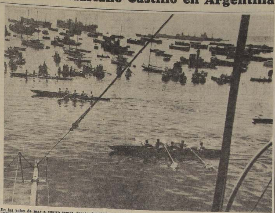
En las volas de mar a cuatro remos, regata disputada en el Campeonato Nacional, el triunfo correspondió en forma estrecha al portenense. El público tuvo oportunidad de presenciar un espectáculo emotivo.

Pedro de Ma, Grünfeld, blancas; Boibochán, negro; Marín, 1 PD; Rosellino, 2 PD; P3AD P3AD; 4 A4A; A2C; 5 P3R; O-O; 6 PXP CXP; CXC; D3C; 8 AXP; C3A; 9 C2R.