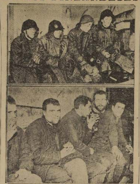
Los fotografías de grupos de prisioneros rusos, tomados en las operaciones de hace algunas semanas en el sector del centro de la línea de batalla.