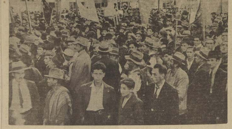
Un aspecto de la concentración de ayer de los obreros de la construcción

QUE EL ESTADO INSTALE FABRICA DE CEMENTO PORTLAND