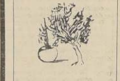
CRUADERO ARBOLES frutales, Irrazaval 3010, esquinilla Lucio Cuadra, 3.50 kilo. Euclalpis, maceteros, Magros, alscacha, tierra, Mercurio, ciprés, Bohe, esparracero Central. Rosa Suazo.

ENTRE MILES, DESTACAMOS ESTAS SEIS OFERTAS DE NUESTROS AVISOS ECONOMICOS CLASIFICADOS.