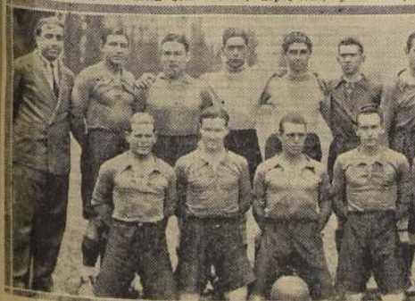
El Transandino de Los Andes, que luchará hoy con el Osorno Atlético, a primera hora, en los Campos de Sports.

En Carabineros de la Avda. Presidente Balmaceda, las corrientes especiales entre nuestras principales autoridades gubernativas, locales, deportivas, políticas y