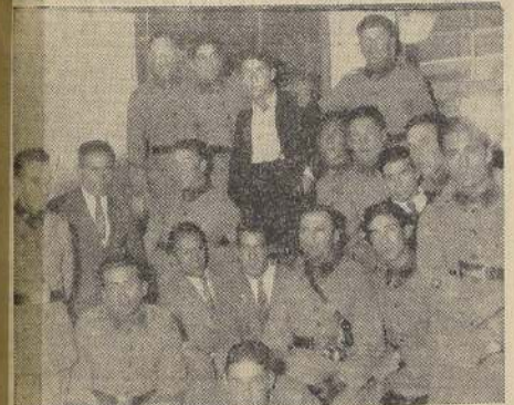
La delegación del Eleuterio Ramírez de Temuco, en su visita a "LA NACION".

Es tarea harto difícil decidirse por ver uno u otro programa, pues casi la totalidad ofrece atractivos similares. El sorteo, hecho entre señores y notorios, que ha sido muy acertado, ofrece la oportunidad para ver partidos de fuerzas equilibradas, con la diferencia que, mientras los primeros disponen de mejor técnica por el mayor contacto con los conjuntos centrales, los últimos con el empuje irresistible que les caracteriza darán las notas fuertes de cada encuentro en que participen.