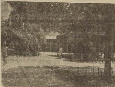
Hermoso interior de la Residencial "Capri", cuya belleza es sobradamente conocida

La Dirección de los Servicios debe cuanto antes proporcionar los bancos y herramien-