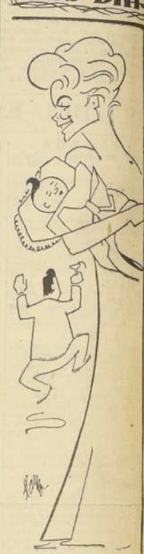
La Princesa Grimaldi, de Mónaco que ayer dio a luz un hijo varón, con lo que se asegura definitivamente la continuación de la dinastía de la Casa de Grimaldi, que ha ocupado el trono desde el año 1297.

SE AGRADECE UN INSULTO. — Una vez, Mark Twain, atropo a un paseante sin darse cuenta. Este le gritó sobreparándose: —¡Idiota! El célebre humorista, sin perder la calma, recibió la injuria como una presentación, y quitándose el sombrero le contestó: —Placer de conocerlo. A sus órdenes Mark Twain.