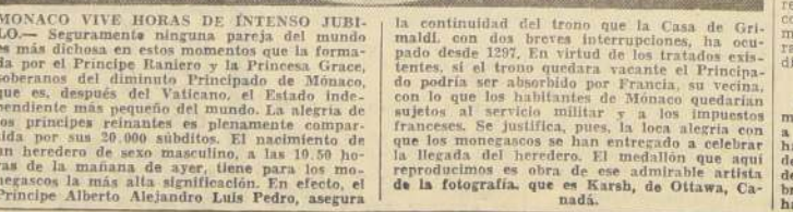
RAINIERO Y GRACE, MEDALLON DE UNA EPOCA

MONACO VIVE HORAS DE INTENSO JUBILO. — Seguramente ninguna pareja del mundo es más dichosa en estos momentos que la formada por el Príncipe Rainiero y la Princesa Grace, soberanos del diminuto Principado de Mónaco, que es, después del Vaticano, el Estado independiente más pequeño del mundo. La alegría de los principitos reinales es plenamente compartida por sus 20.000 súbditos. El nacimiento de un heredero de sexo masculino, a las 10.50 horas de la mañana de ayer, tiene para los monégacos la más alta significación. En efecto, el Príncipe Alberto Alejandro Luis Pedro, asegura la continuidad del trono que la Casa de Grimaldi, con dos breves interrupciones, ha ocupado desde 1297. En virtud de los tratados existentes, si el trono quedara vacante el Principado podría ser absorbido por Francia, su vecina, con lo que los habitantes de Mónaco quedarían sujetos al servicio militar y a los impuestos franceses. Se justifica, pues, la loca alegría con que los monégacos se han entregado a celebrar la llegada del heredero. El medallón que aquí reproducimos es obra de ese admirable artista de la fotografía, que es Karsh, de Ottawa, Canadá.