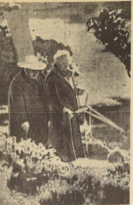
NIZA.— Por primera vez, después de su reciente enfermedad, el anciano estadista inglés Sir Winston Churchill dio ayer un paseo por las calles adyacentes a su residencia, en compañía de Lady Churchill.

El cambio más importante parece ser el del número de ministros. Los nuevos ministros—a excepción de Solís—son de menor rango que los anteriores, con excepción de Solís y Malik, que ocupaban cargos de alto rango.