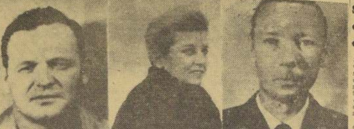
WASHINGTON.—El FBI anunció que sus agentes descubrieron una operación ilegal de ventas de ametralladoras de la Fuerza Aérea de los Estados Unidos al Gobierno de Fidel Castro, por un valor de 189 mil dólares.

Adenauer insistió en que es necesario recordar a los habitantes de Alemania oriental en la Navidad, para que "sepan y sientan que no han sido olvidados por los pueblos del mundo libre, que jamás serán olvidados y que un día las campanas de la libertad doblarán para ellos".