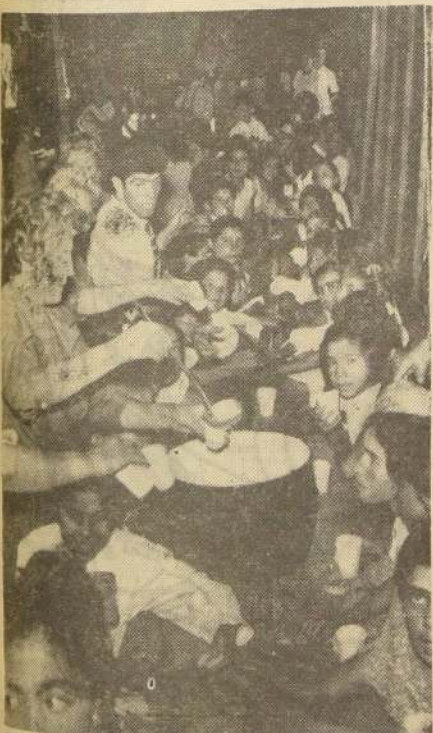
TE DE NAVIDAD.— Mil seiscientos niños de la Población "La Vallería Sur" tuvieron el lunes último la satisfacción de ver agasajados con un té navideño por las damas de Caritas-Chile. Los pequeños bebieron sabroso chocolate y recibieron golosinas y dulces donados por benefactoras de la institución. En el grabado, las damas de Caritas-Chile en plena labor