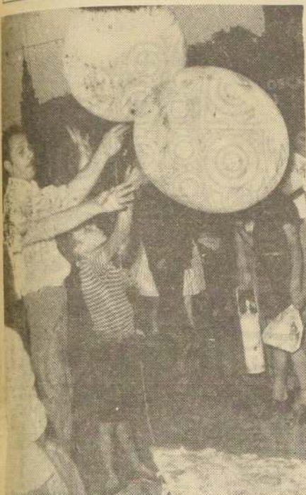
El globo, de tamaño gigante y hermosas policromías, se adueña de la calle. Es el juguete más popular y más barato. Es el adorno del árbol de Pascua que más jerarquía da a éste en la Noche Buena.