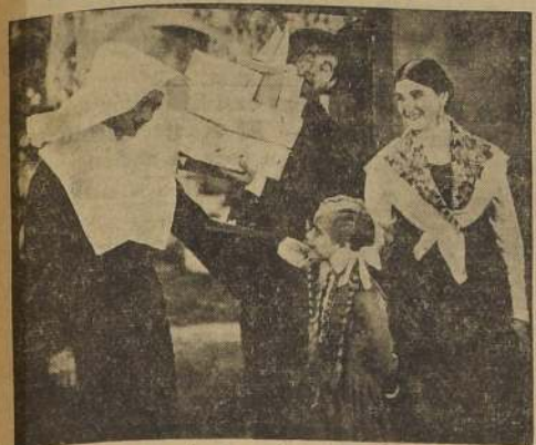
Una escena de la película mexicana "No basta ser madre", que pasa hoy el Coliseo