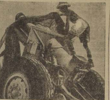
Artilleros norteamericanos, en el desierto occidental, quitan la red con que habían camuflado a un cañón de 155 mm. Esta arma francesa se produce ahora en Estados Unidos, y es usada con resultados espléndidos en los duelos de artillería con el Afrika Korps.