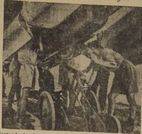
Cargando las bombas en un "Beaufort" de la R. F. A. Estas bombas están destinadas a los italianos, pues éste es uno de los que protegen los convoyes británicos que llevan víveres a Malta.