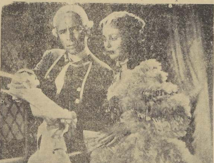
El aplaudido actor inglés Ronald Colman, aparece aquí junto a la bella Loretta Young en una escena de "Alborada Imperial", la superproducción que estrenará la Terra el martes próximo en el Teatro Central.

Loretta Young es la primera figura femenina de "Alborada Imperial"