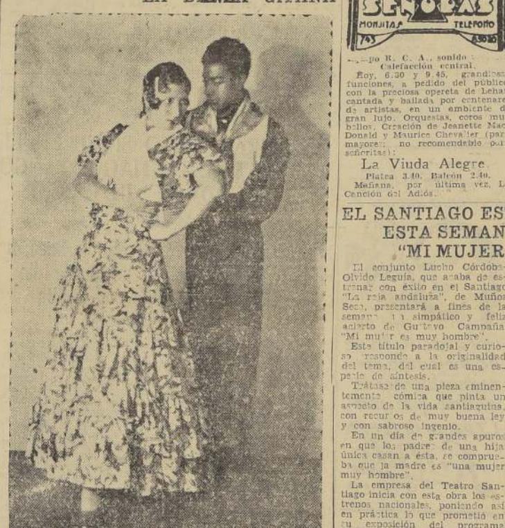
Miguel Albaicín en una de sus notables y celebradas danzas flamencas con Pilar López

MIGUEL DE ALBAICIN, FINO EXPONENTE DE LA DANZA GITANA