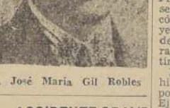
D. José María Gil Robles

Pero Lerroux logró convencerlo de que la retirara