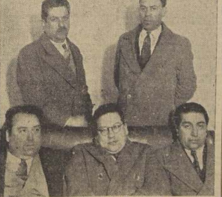
Los representantes del gremio de autobuses de Valparaíso, en LA NACION

En la tarde de ayer recibimos la visita de una delegación del Sindicato Profesional de Propietarios de Autobuses de Valparaíso, que vino a la capital a entrevistarse con el Presidente de la República, que los recibió en audiencia especial en marcos.