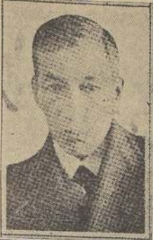
D. Daniel Salamanca

La disputa secular sobre los territorios del Gran Chaco se hizo más aguda en junio de 1932, y Bolivia y el Paraguay, luego rompieron las hostilidades. Después de una serie de reveses sufridos por el ejército boliviano, el Presidente Salamanca visitó el alto comando en Villa Montes, donde fue hecho prisionero por las fuerzas al mando del General Piaranday, y en seguida dimi-